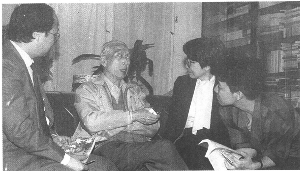
1988年深秋在家中接待香港、台湾朋友