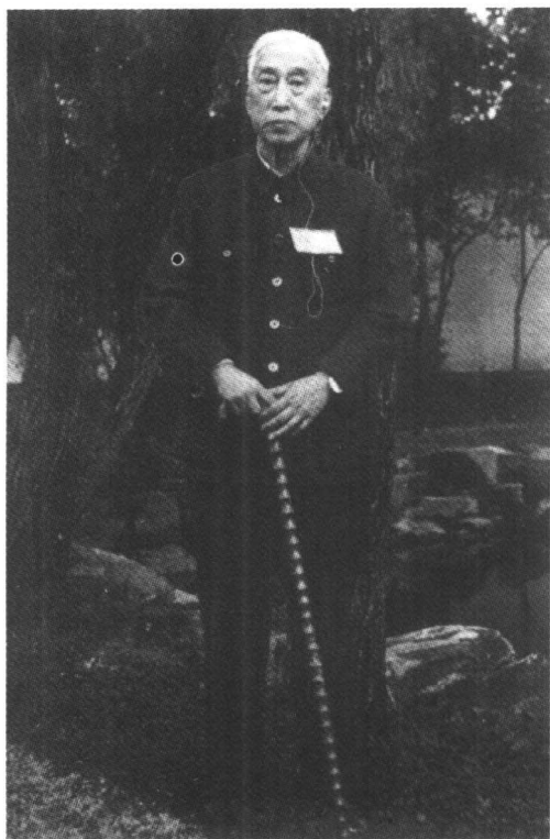
80年代中期摄于绍兴沈园