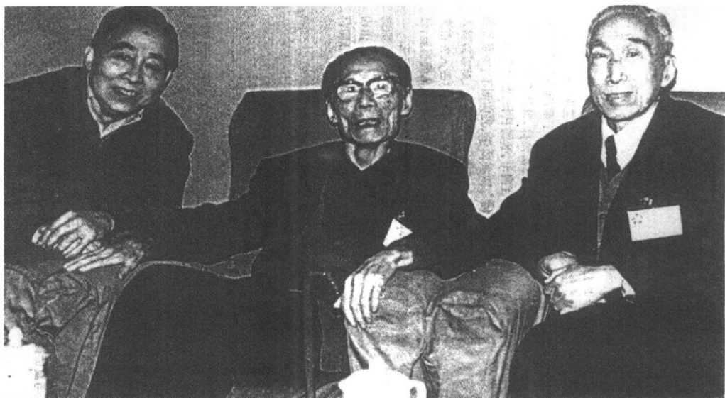
“文革”结束后与夏衍、桑弧合影