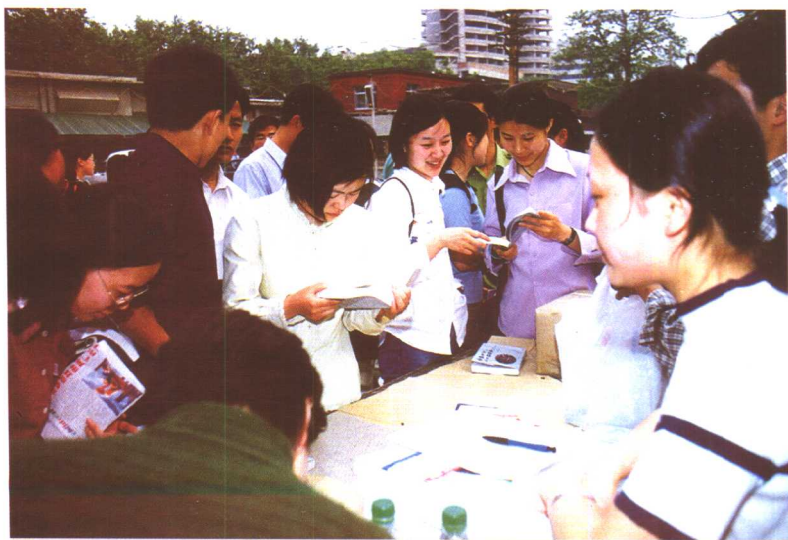
先睹为快——郑州大学的学生们在争相传阅《启思录》