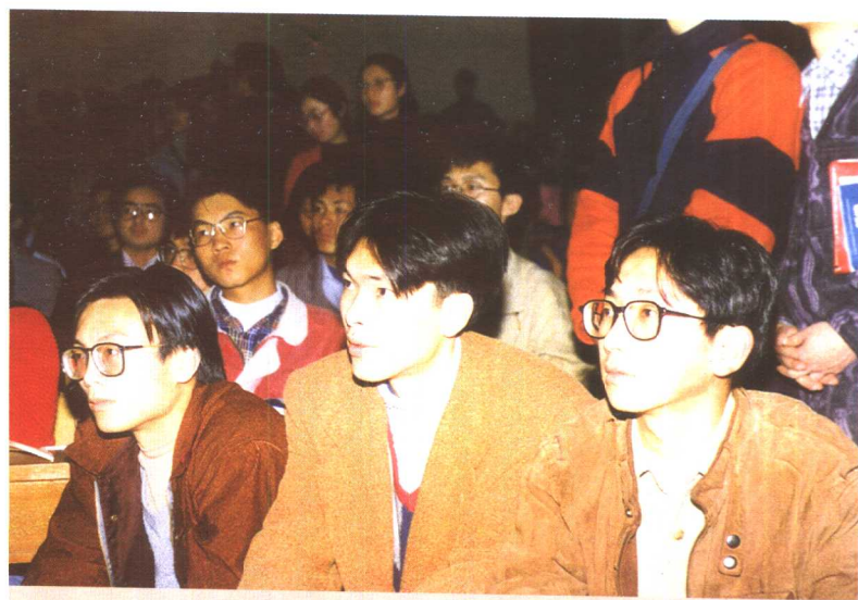
渴望与思考——人文讲座上的大学生