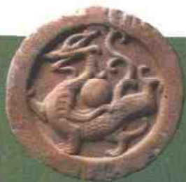
三国指魏（220—265）、 蜀（221—263）、吴 （222—280）。