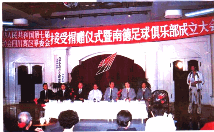
南德文化事业(之一)