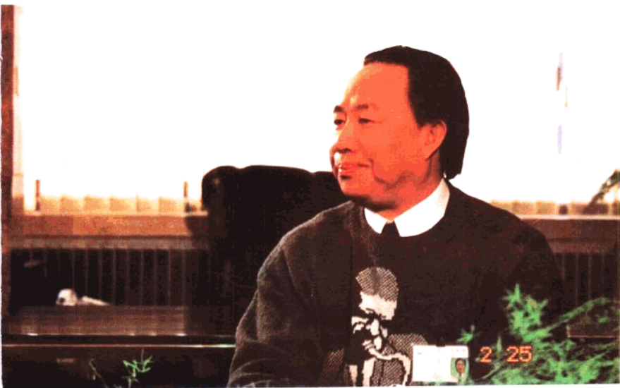
南德经济集团总裁牟其中先生近影