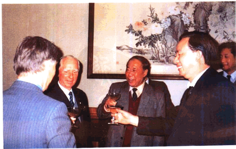
签署合作意向后举杯共庆