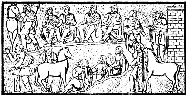
图1 日耳曼人的民众会议

議上也审判他們认为是罪行最严重的叛逆和懦怯。他們把叛徒吊死在树上，把懦夫淹死在池沼里。