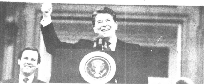
里根竞选连任取胜后高兴地发表讲话。