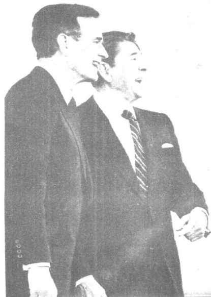
乔治·布什与罗纳德·里根在一起。