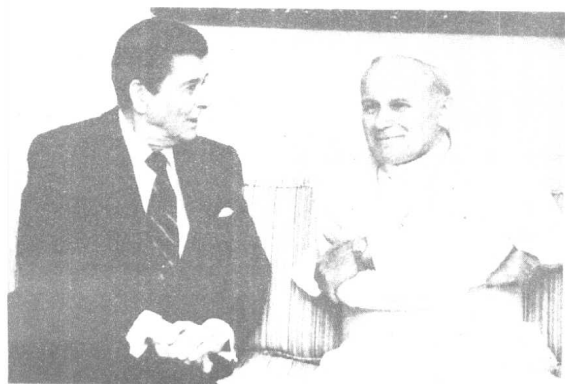
同教皇约翰·保罗二世在一起。