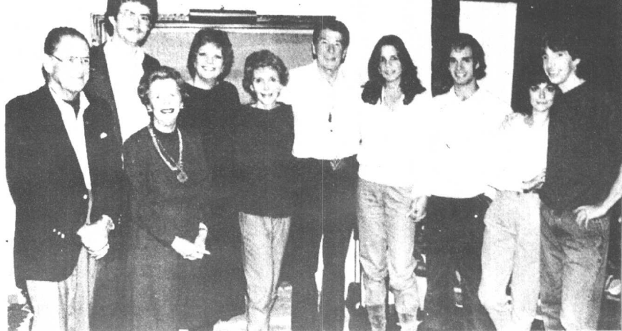
里根家族合影。从左至右：尼尔·里根（总统的哥哥）、丹尼斯·里维尔（玛琳·里根丈夫）、贝斯·里根（尼尔的妻子）、玛琳·里根、南希和罗纳德·里根、帕蒂·戴维斯 保罗·格里瑞（帕蒂的丈夫）、多丽·里根（小罗纳德的妻子）、小罗纳德·里根。