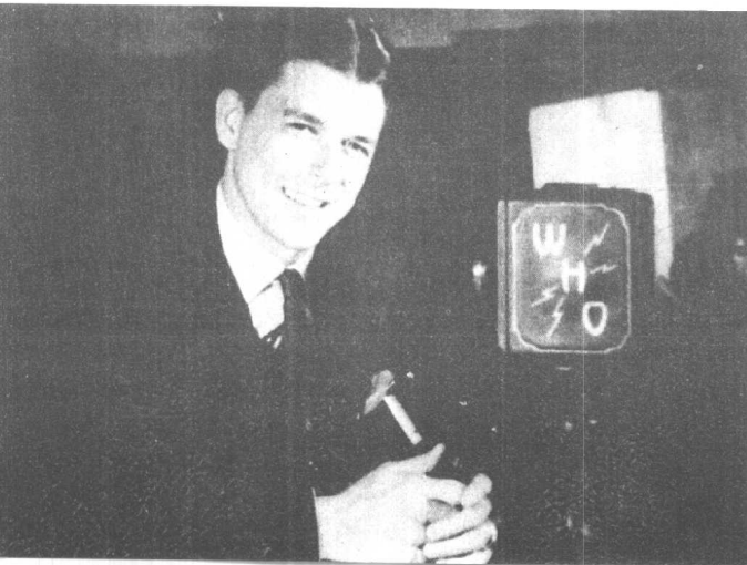
三十年代中 期，里根的 声音为中西 部地区的人 所熟知。