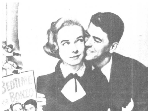
里根所饰演的两部电影的宣传广告画。