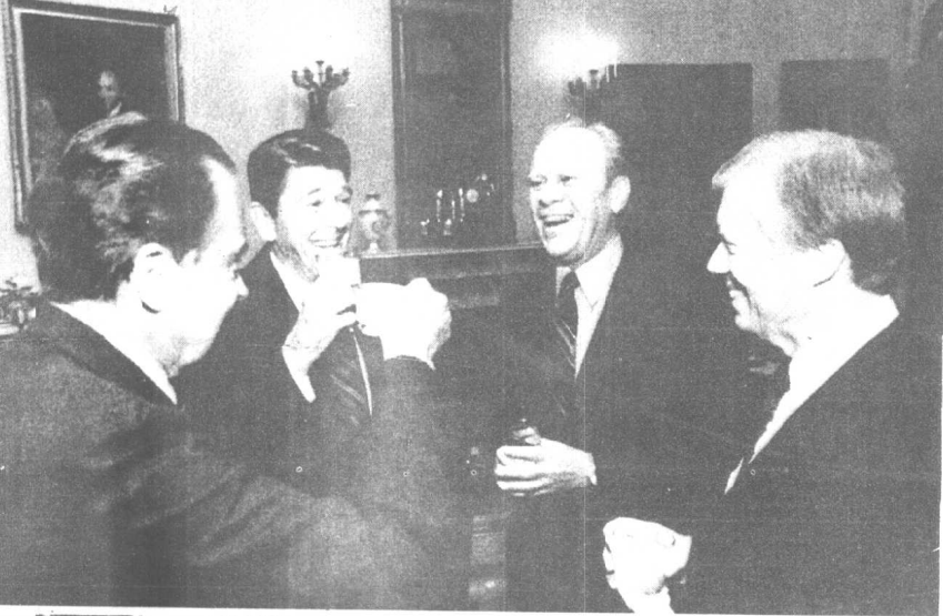
里根与前总统理查德·尼克松、杰拉尔德·福特、吉米·卡特在一起。