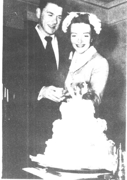
罗纳德·里根与南希·戴维斯结为伉俪。