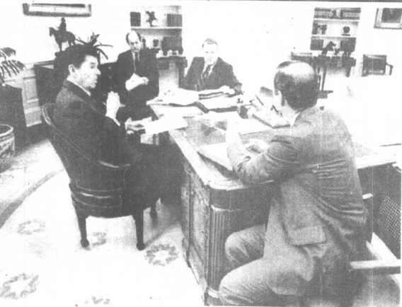
在椭圆形办公室里会见白宫的高级助理们。