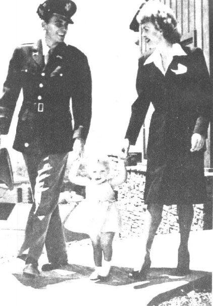
里根离家去美国军队中服役并任陆军航空兵少尉。女演员简·怀曼（里根的前妻）和他们的女儿玛琳·伊莉莎白为他送行。