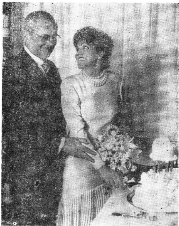
艾柯卡与新婚妻子佩吉(1987年)