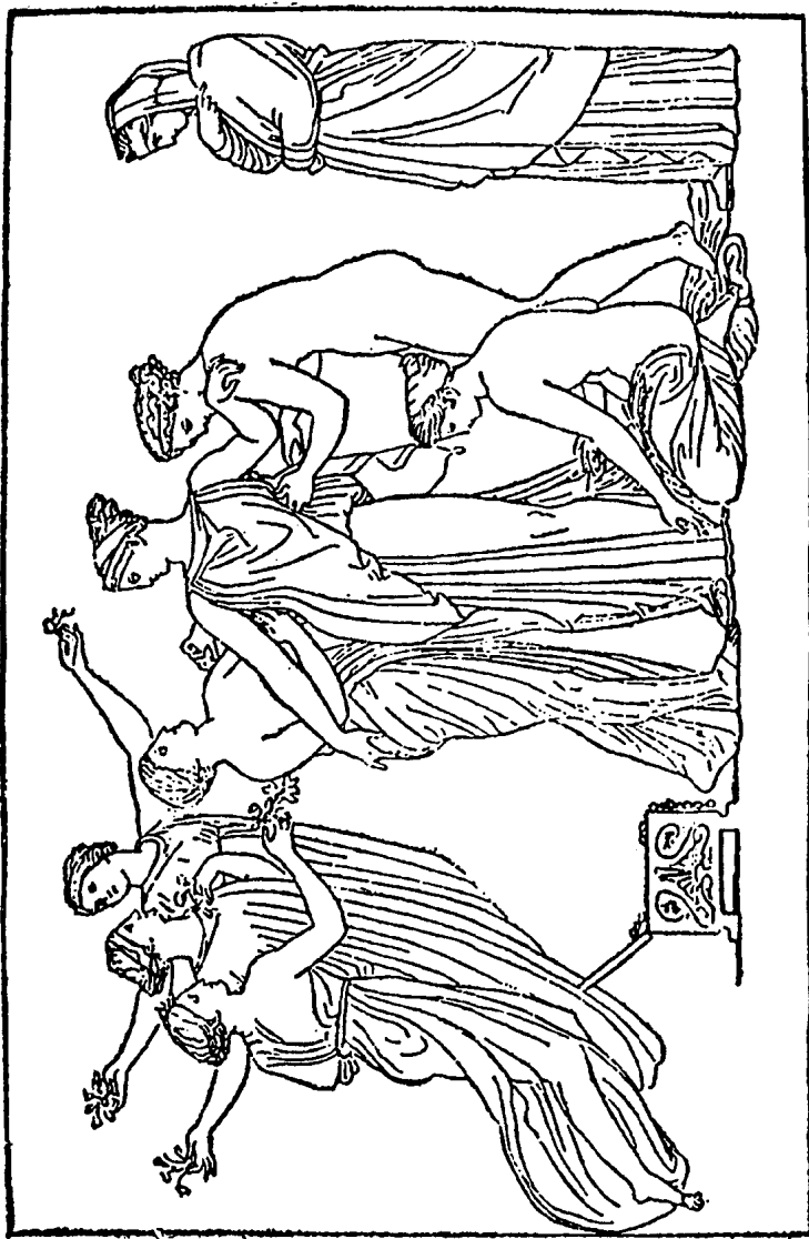
潘多拉被美惠三女神与时光女神所装饰。