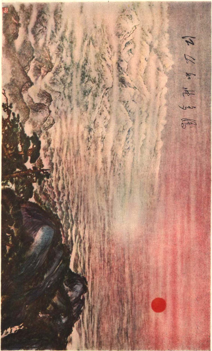
江山如此多嬌(国画)傅抱石 关山月