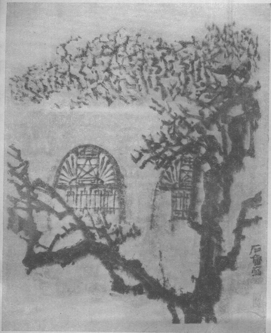
东方欲晓（国画）石魯