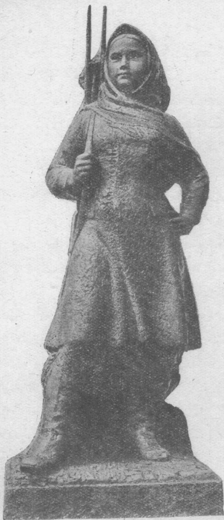
草原民兵（雕塑）孙纪元