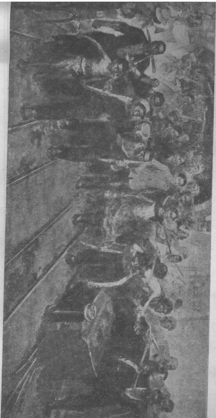
刘少奇同志和安源矿工（油画） 侯逸民