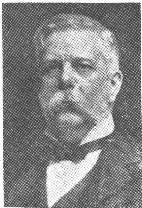
屋西治喬——才奇明發