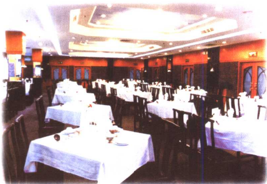
文苑南餐厅（茶皇厅）