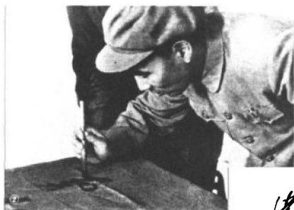
林彪正在书写歌颂毛泽东的题词