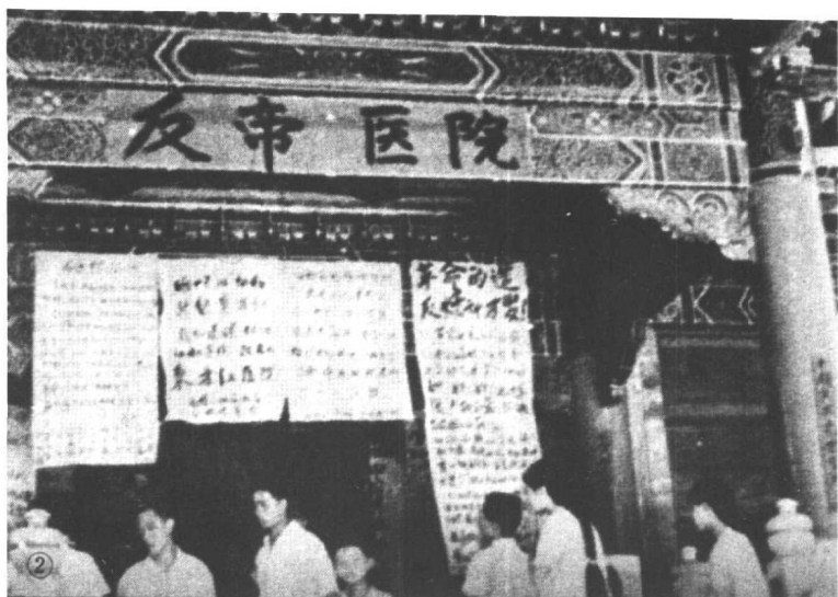
红卫兵认为“协和医院”和美帝国主义侵略有关，将该医院更名为“反帝医院”。