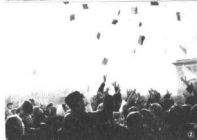
①北京某高校批判会现场