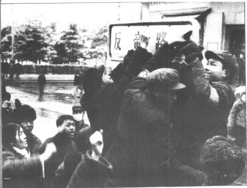
北京的红卫兵在街头更改街名