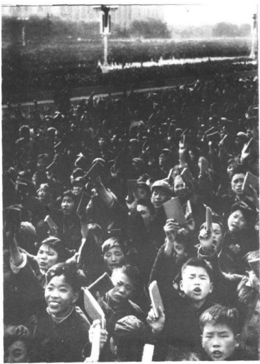
全国各地到京的红卫兵在天安门广场上高举“红宝书”不停地高呼“毛主席万岁”。