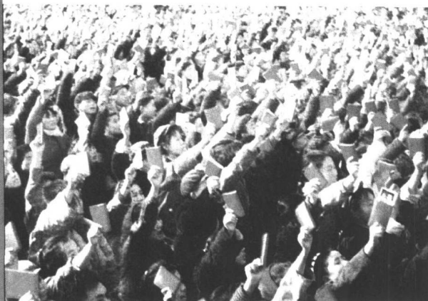
天安门广场上的 红卫兵向毛泽东 欢呼万岁