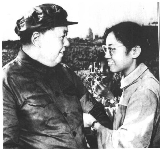
北京红卫兵给毛泽东戴红卫兵袖章