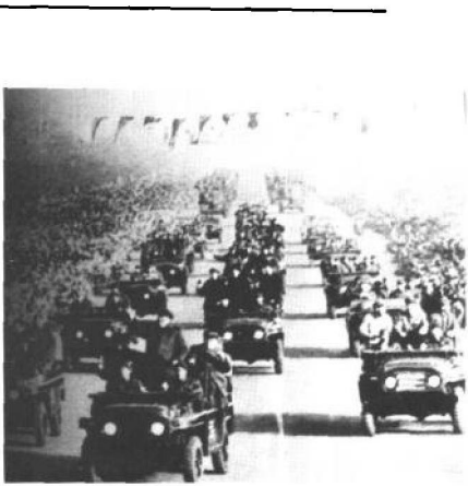
1966年8月18日至11月26日，毛泽东先后八次接见了1100多万红卫兵。

北京清华附中红卫兵的三篇论“造反”的文章受到毛泽东的赞扬后，被全国各报转载，广为宣扬。