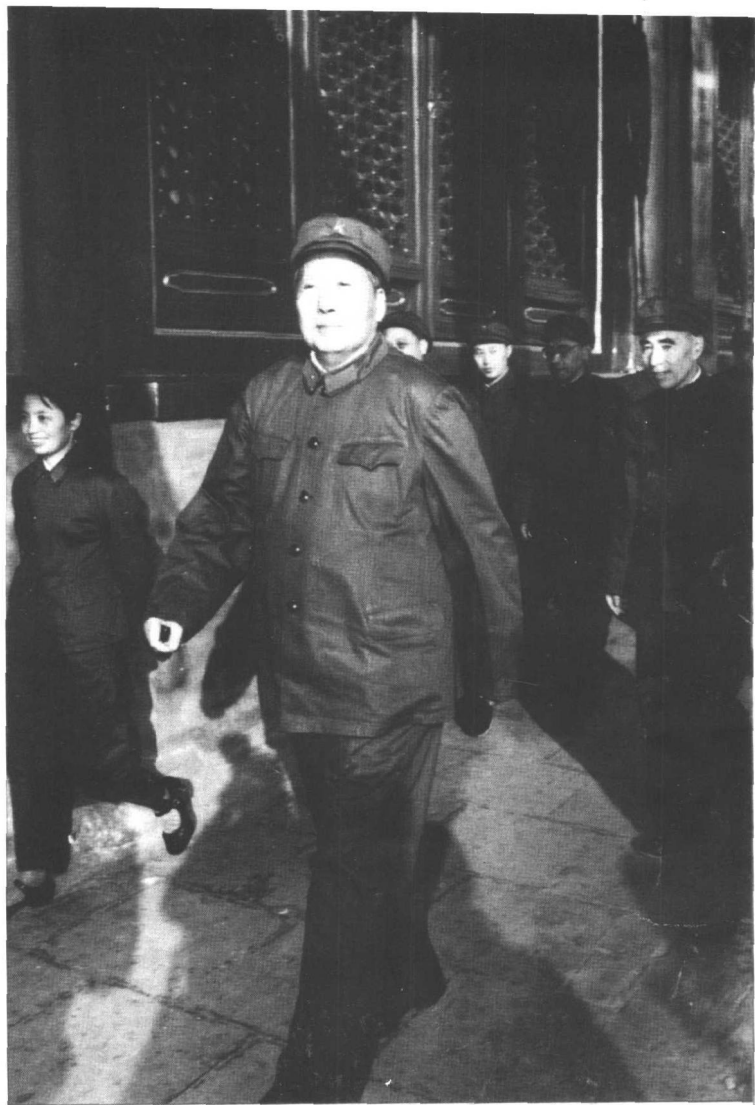
毛泽东发动了“文化大革命”