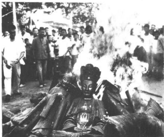
1966年9月中旬，安徽省合肥市的造反派和红卫兵将万福庵内的佛像砸毁后，搬到马路上焚烧。