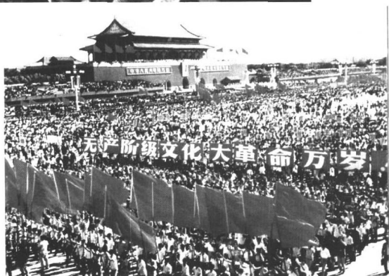
浩浩荡荡的游行队伍