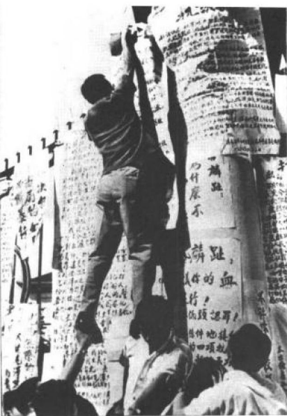
红卫兵运动影响很广，香港爆发反英示威。