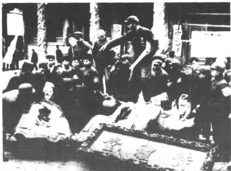
孔庙大成殿内的孔子、四配、十二哲等塑像全被拉倒，准备运出殿外砸毁和焚烧。