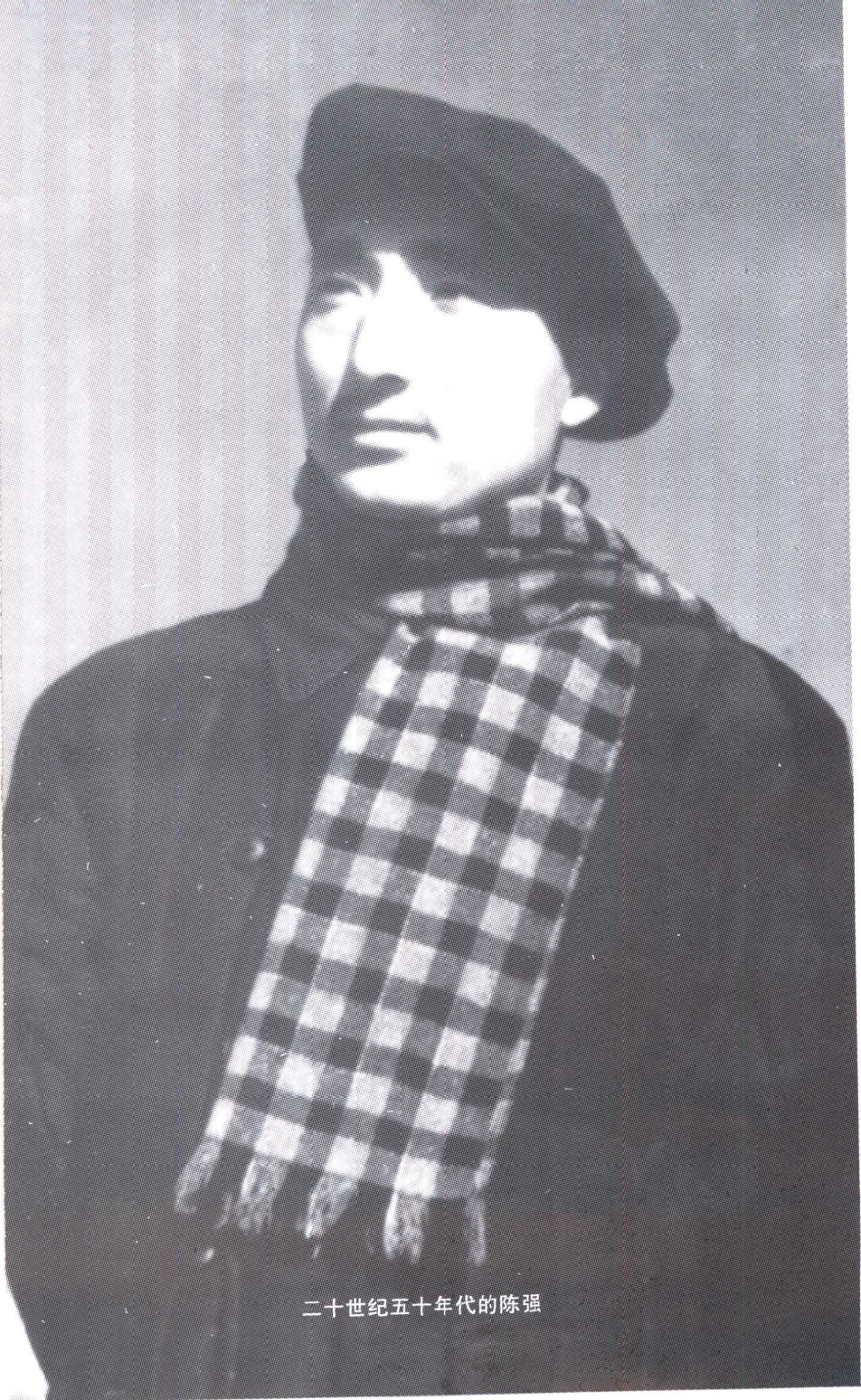
二十世纪五十年代的陈强