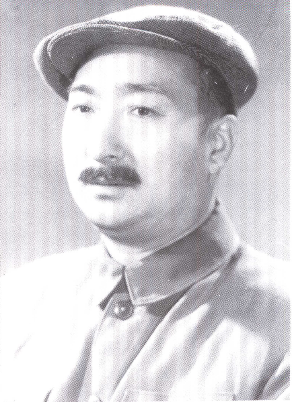
二十世纪七十年代的陈强