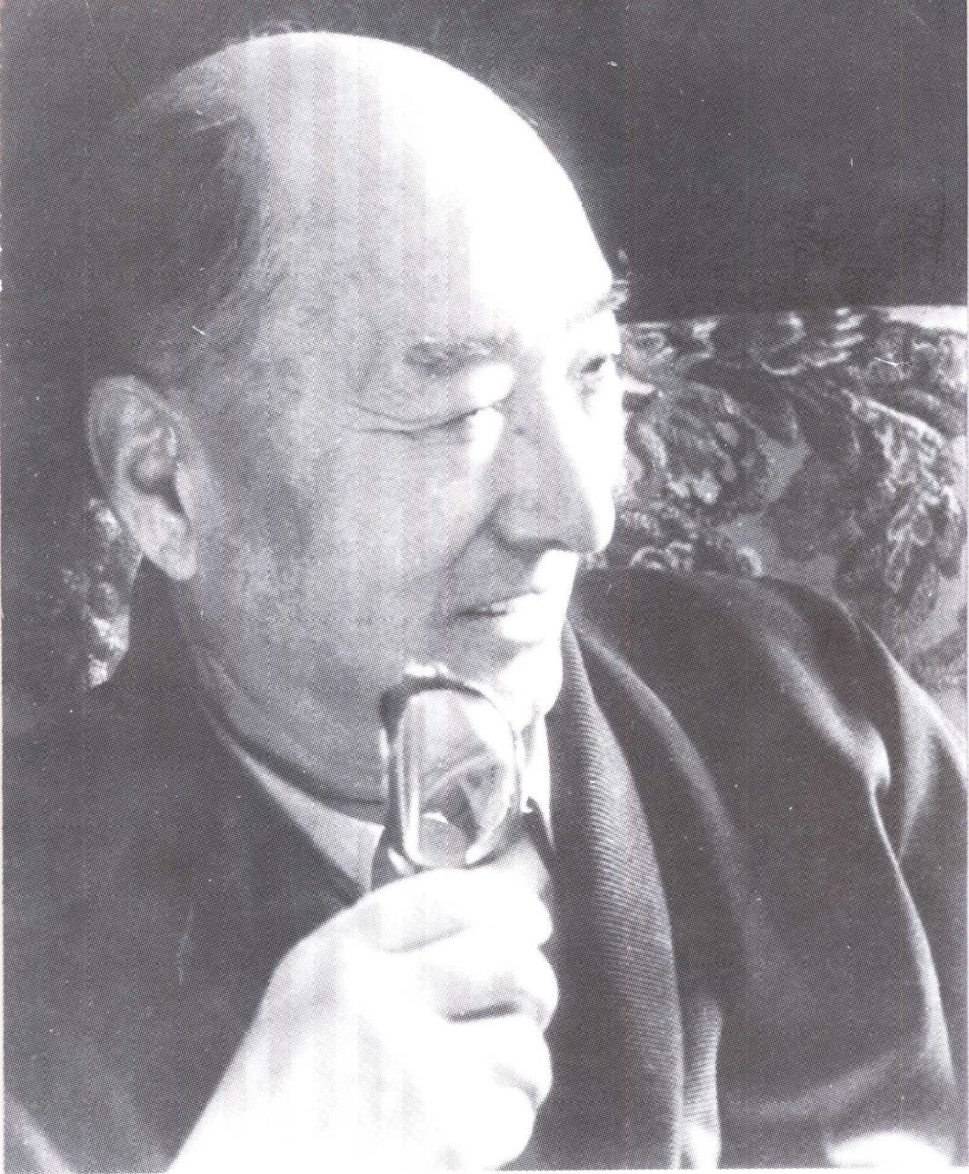
二十世纪八十年代的陈强