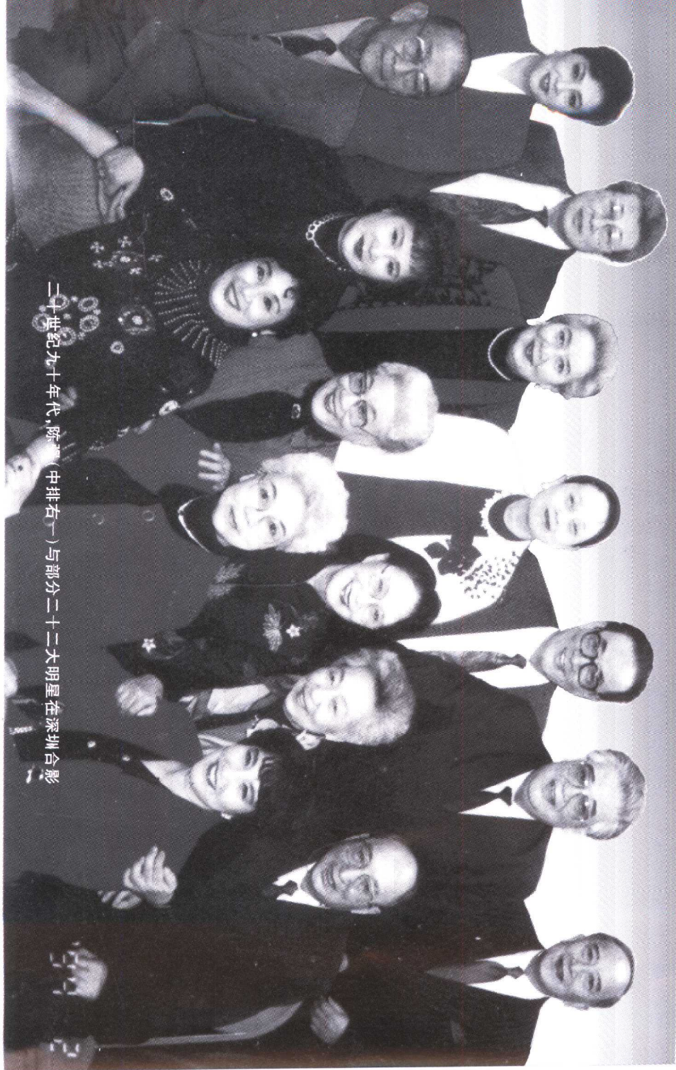
二十世纪九十年代,陈冠中(中排右一)与部分二十二大明星在深圳合影