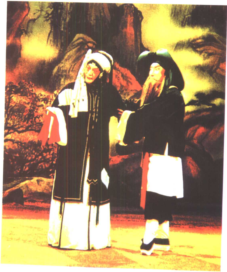
程砚秋《荒山泪》中饰张慧珠