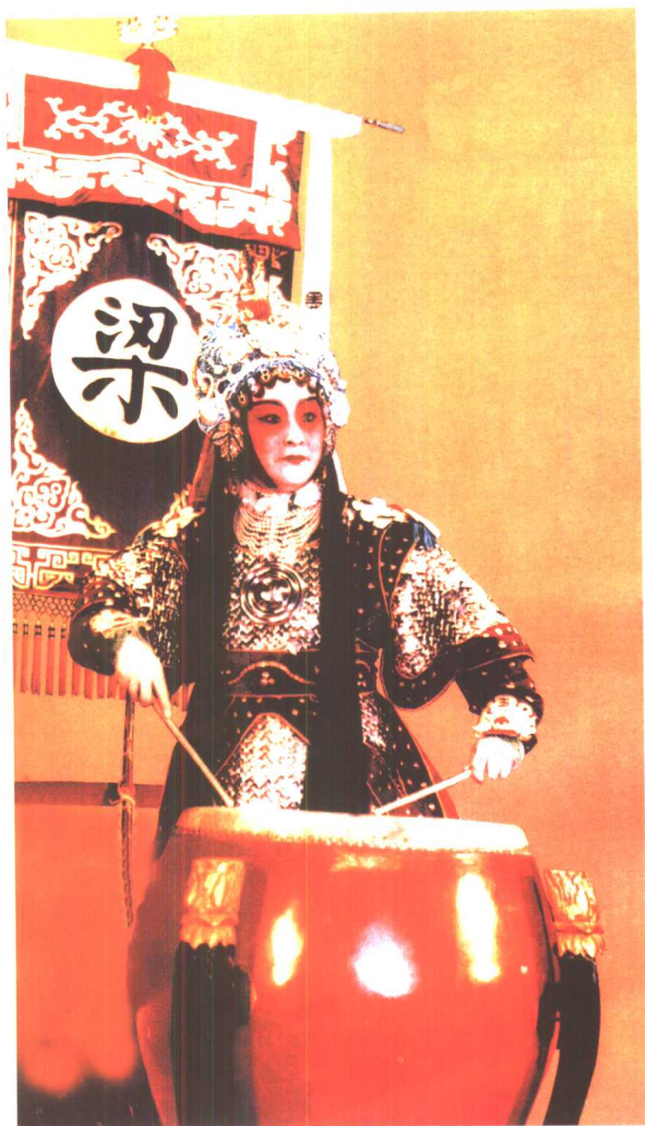
尚小云《梁红玉》中饰梁红玉