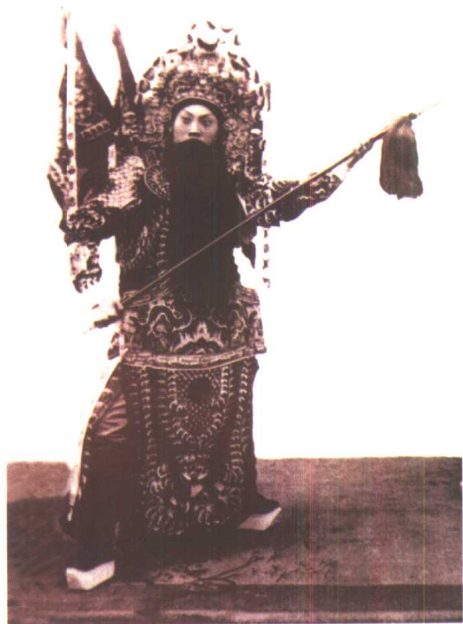
余叔岩《宁武关》中饰周遇吉