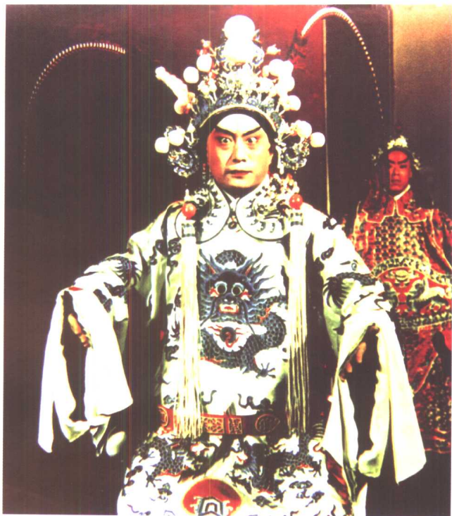
叶盛兰《群英会》中饰周瑜