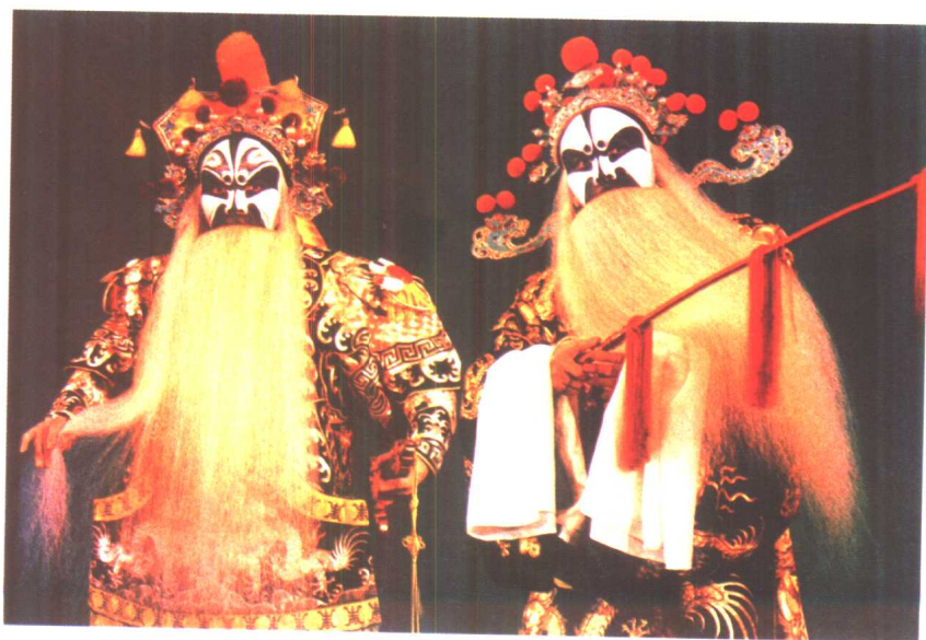
裘盛戎《姚期》中饰姚期