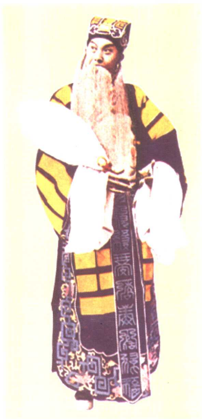
高庆奎《空城计》中饰孔明