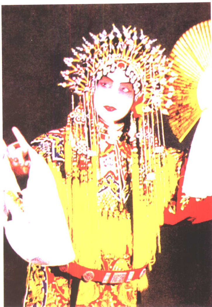
梅兰芳《贵妃醉酒》中饰杨贵妃