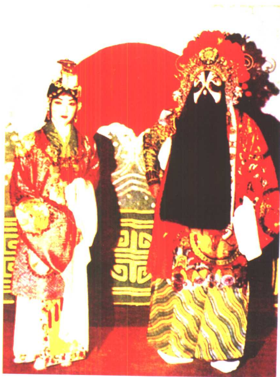
金少山《霸王别姬》中饰项羽