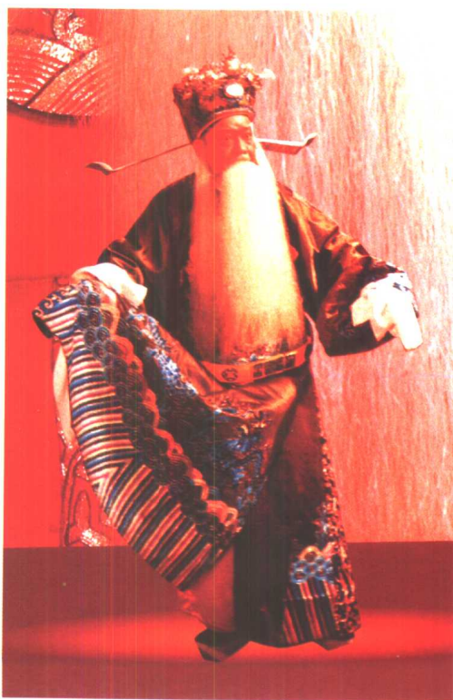
周信芳《徐策跑城》中饰徐策