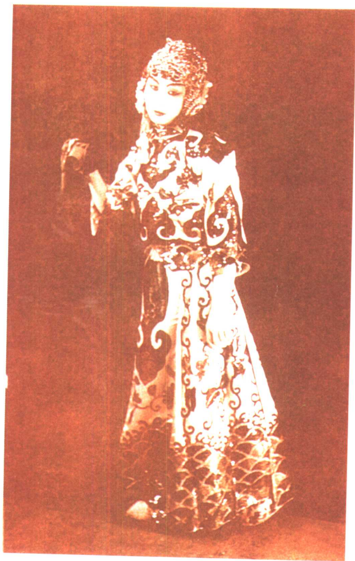
荀慧生《勘玉钏》中饰韩玉姐