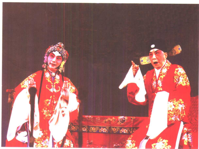
俞振飞《奇双会》中饰赵宠