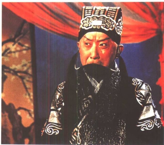
马连良《群英会》中饰诸葛亮