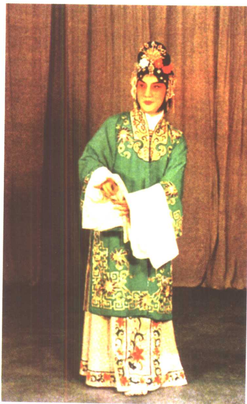
张君秋《望江亭》中饰谭记儿