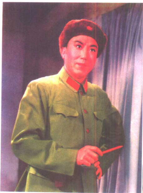
沈金波《智取威虎山》中饰少剑波