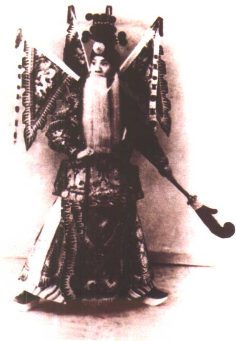
言菊朋《定军山》中饰黄忠