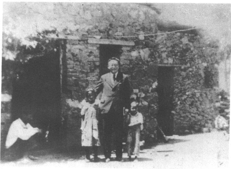
陶行知在墨西哥调查华工生活时与华工子女留影