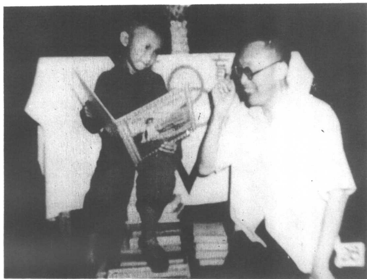
与育才学校儿童在一起