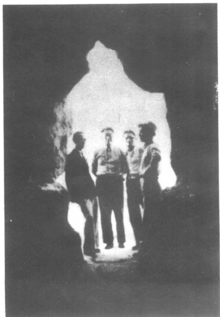
1938年7月底，埃及开罗，陶行知与纳忠诸先生在金字塔入口处