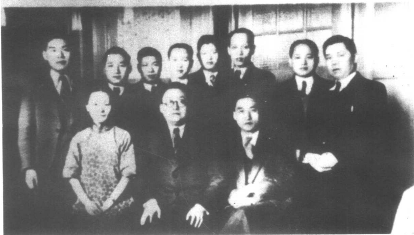
1938年2月24日荷兰华侨欢送陶行知赴法留影