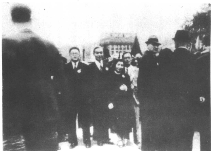
1938年7月，陶行知在巴黎参加华侨宣传抗日游行