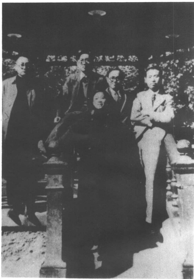
1937年9月26日，陶行知出席巴黎全欧抗日救国联合会时 与钱俊瑞（后右二）、任光（后左二）、陆瑾（前中）合影