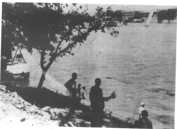
尼罗河畔留影(正中背立者是陶行知)