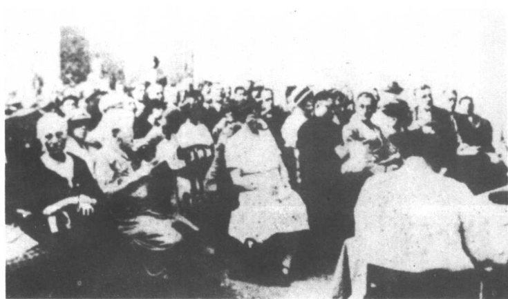
布鲁塞尔世界和平大会会场之一部（前排着深色衣者为陶行知）