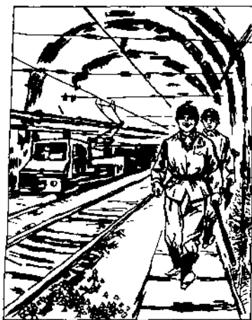
图 2-4 大巷行走