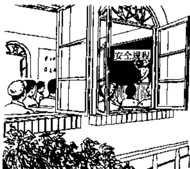
图 2-1 下井前学规程

下井前，莫忘记，带好矿灯自救器。 化纤衣服不能穿，禁带火具和香烟。 矿工靴，要穿好，时刻戴牢安全帽。 不喝酒，休息好，精力集中效率高。 持证上岗要牢记，井下处处要注意。 导电材料和工具，严防接触带电体。 尖刃工具要套上，防止意外把人伤。 带着工具乘车罐，不准超出车、罐帮。