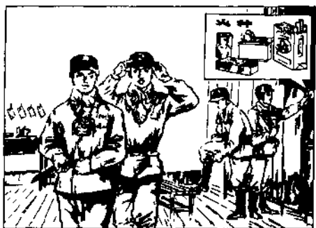
图 2-2 穿戴整齐排队下井

进出罐笼、上下车，服从指挥要自觉。 罐、车之内守纪律，不许打闹和拥挤。 乘人车，且莫站，不准用手扒车沿。 斜巷行车不行人，声光信号要留神。 皮带、溜子不能坐，严禁爬、蹬和跳车。 来往车辆看仔细，跨越轨道要注意。