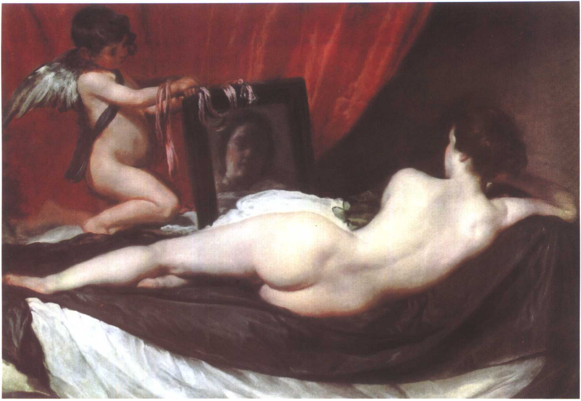
镜前的维纳斯 约1648—1651 西班牙 委拉斯贵支