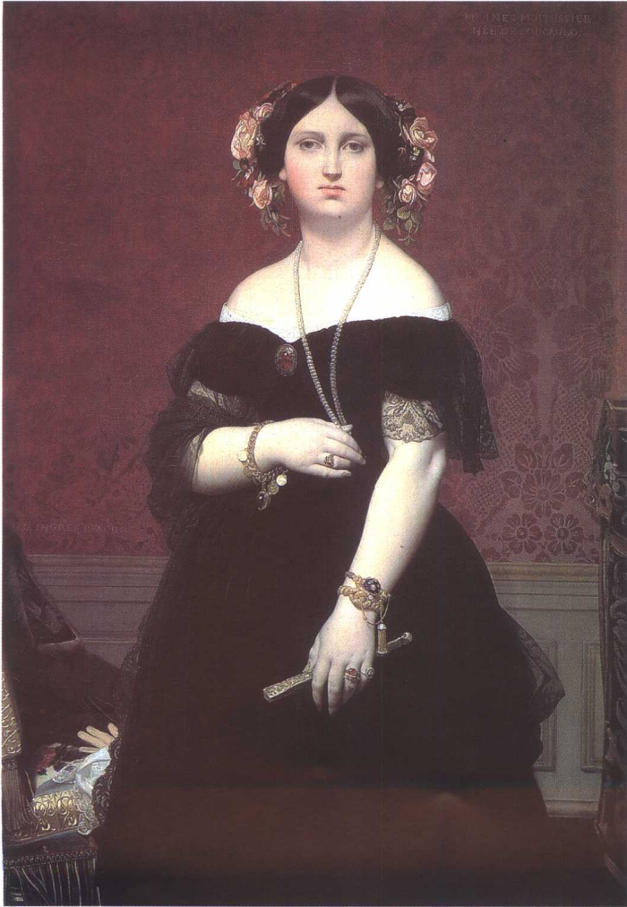
莫瓦特雪夫人 1851 法国 安格尔