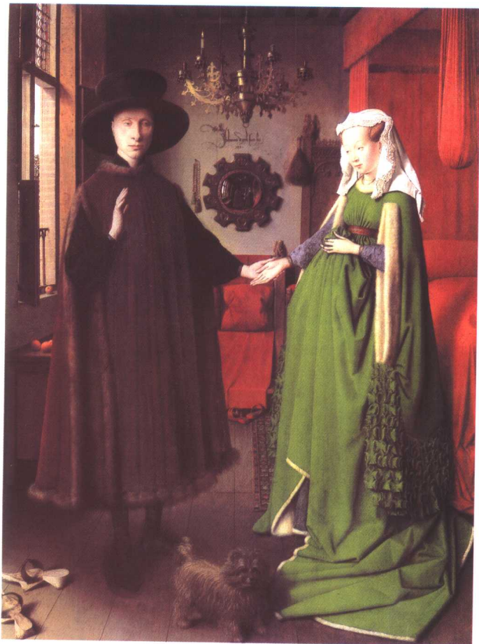
阿尔诺尔芬尼夫妇像 1434 尼德兰 扬·凡·爱克