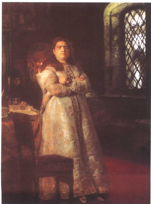
索菲亚公主 1879 俄罗斯 列宾