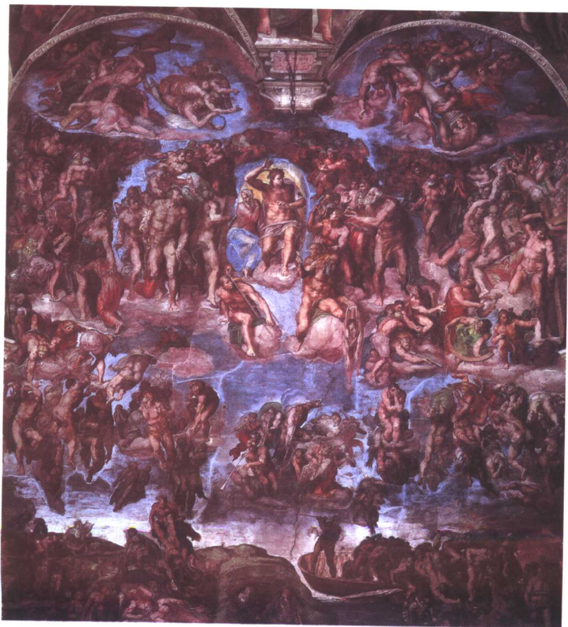
最后审判 西斯廷礼拜堂壁画 1535 意大利 米开朗琪罗