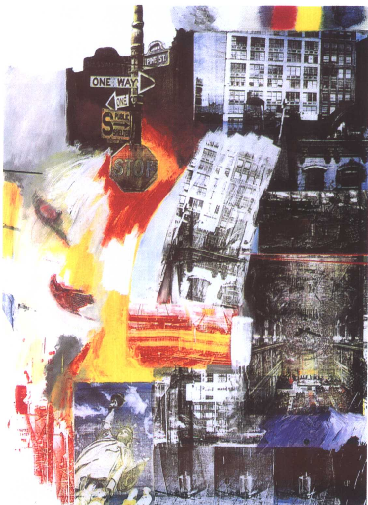
土地 1963 美国 劳森伯格