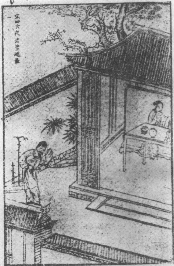
宋四公夜盜禁魂張 (明天許齋刻本“全像古今小說”第三十六卷插圖)