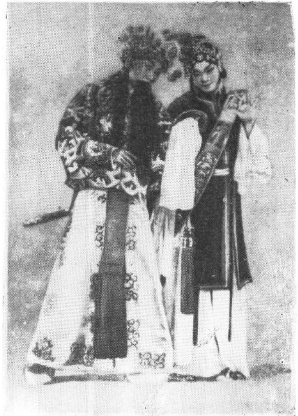
《武家坡》 程砚秋饰王宝钏 杨宝森饰薛平贵 柴俊为供稿