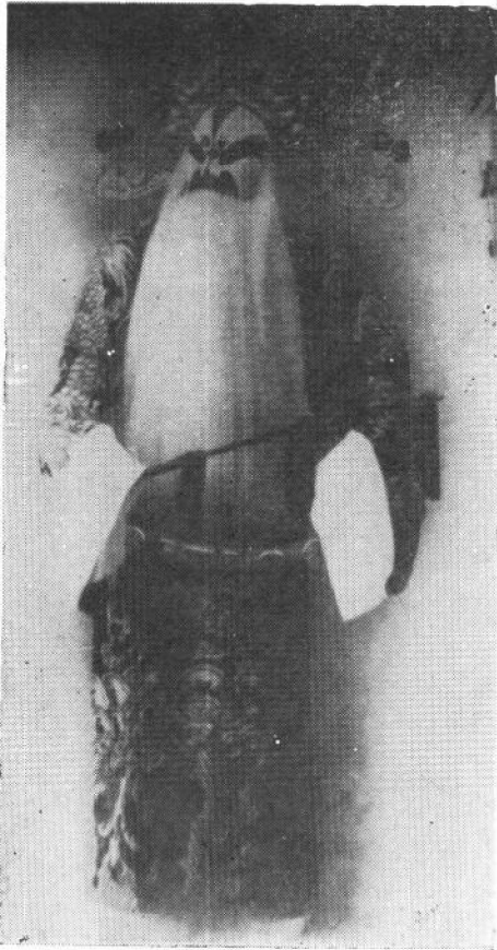
《姚期》 裘盛戎饰姚期 柴俊为供稿