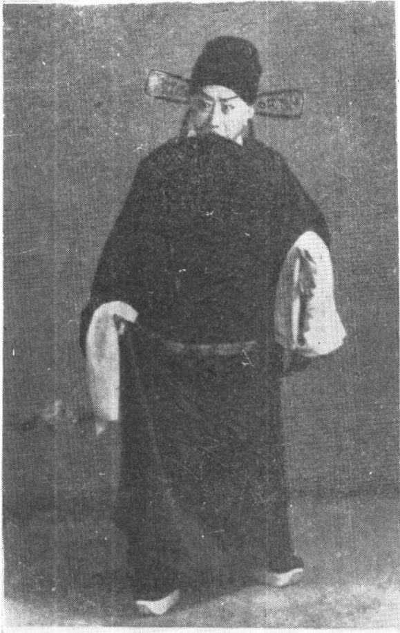
《清官册》 马连良饰寇准