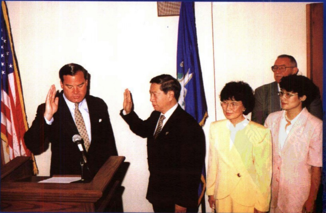
李昌钰宣誓就职。右为李夫人 宋妙娟，女儿李孝美。