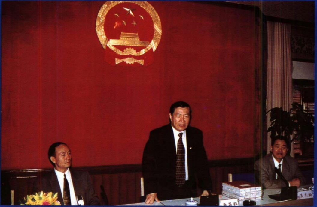
李博士在国内讲学。