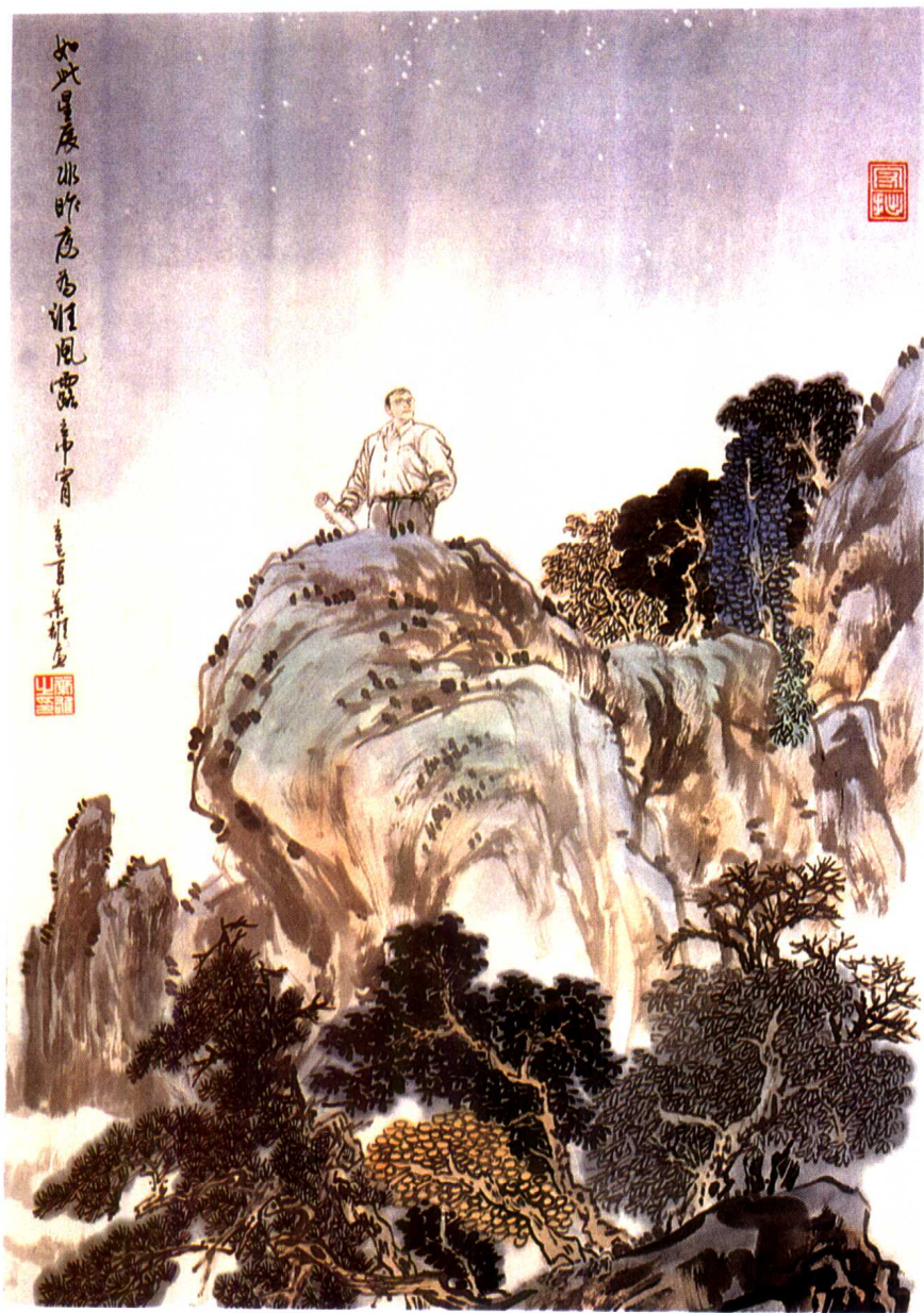
“如此星辰非昨夜，为谁风露立中宵？”（参见《神秘的星空》及《人定胜天吗？》二文）