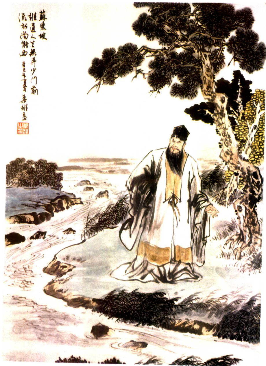
苏东坡：“谁道人生无再少，门前流水尚能西。”（参见《美梦》一文）叶 雄画