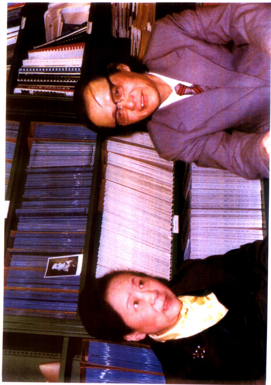
1981年秋，沈致远先生访问吴健雄教授。摄于美国哥伦比亚大学物理楼。（参见《访问吴健雄》一文）