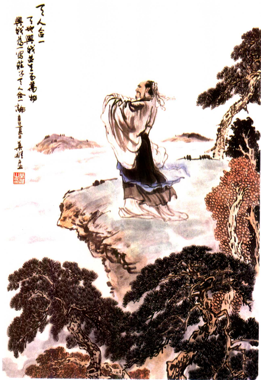
“天人合一”，追索天与人的相通之处，追求天与人之间的和谐，成为东方哲学的特色之一。（参见《“天人合一”之现代版》一文） 叶雄画