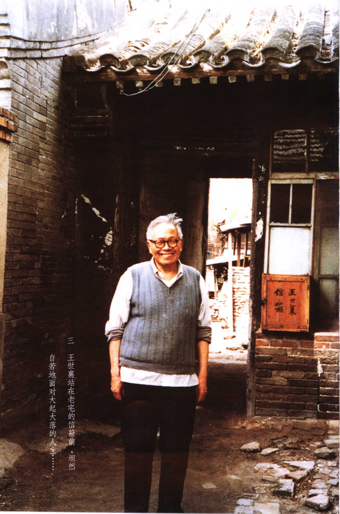
三 王世襄站在老宅的信箱前，坦然 自若地面对大起大落的人生……