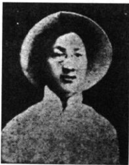
志摩在杭州府中时