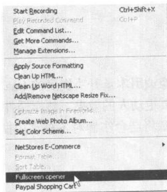
图 1-1 安装好的 Fullscreen opener 插件

ZIP 文件里往往自带 Readme 文件，我们可以根据它来安装下载的插件。比如现在我们来安装一个 Fullscreen Opener 的命令类插件，把 ZIP 文件解压到 Configuration/Commands 目录下。安装完成之后，重新启动 Dreamweaver，我们就可以在 Commands 菜单栏里看到 Fullscreen Opener 项，如图 1-1 所示，这个插件就可以和其他内部插件一样方便地使用了。