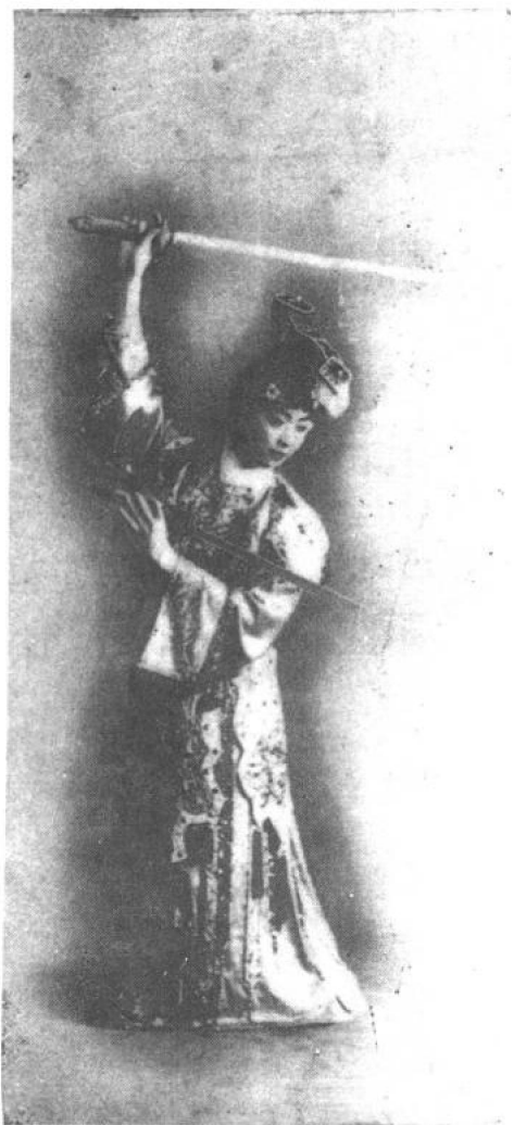
《霸王别姬》 梅兰芳饰虞姬 秀芸供稿