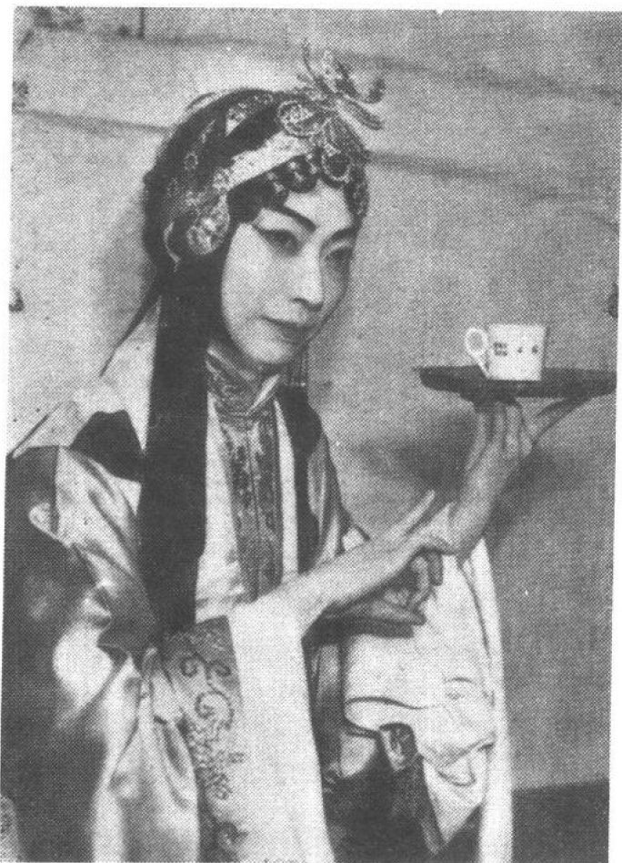
《生死恨》 梅兰芳饰韩玉娘 许姬传供稿