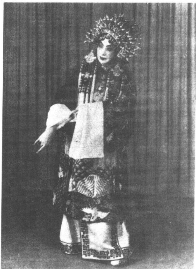
《宇宙锋·金殿》 梅兰芳饰赵艳容