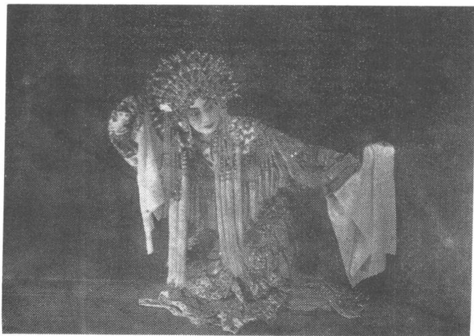
《贵妃醉酒》 梅兰芳饰杨玉环