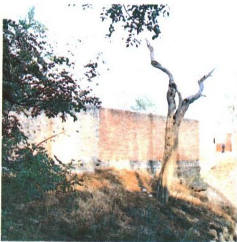
古柘馆遗址 古柘馆位于连庄镇高裴村，该馆建于清代晚期，为王翰林设帐处。现枯柘犹存。