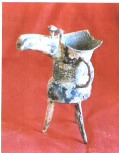
夔纹平底爵 系商代青铜酒器，1989年6月于清河县杜村出土。（滕骏生 摄）