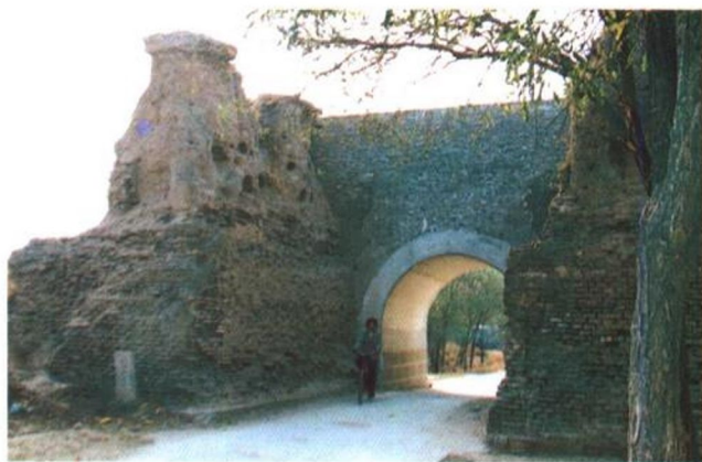
明城南门遗址 明城于明正德七年间修,仅占宋城东南一隅,周仅三里,砖城,毁于1938年。