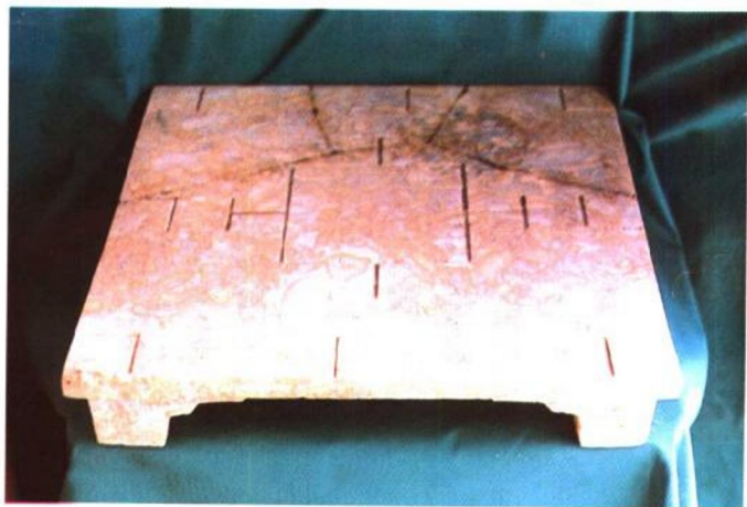
六博棋盘 1987年于清河县刁楼庄出土，系汉代博具。