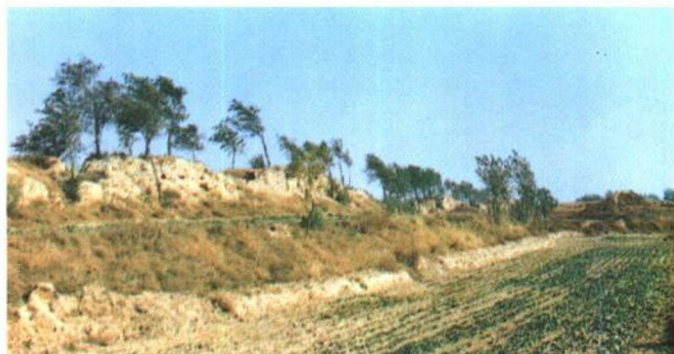
宋贝州城遗址 原为土城,宋元佑六年间修,城周九里,灰土夯筑而成。