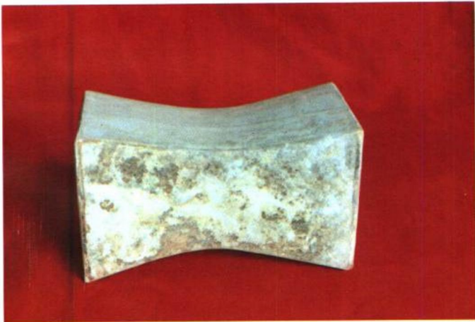
银锭形白釉瓷枕 为宋代瓷器。