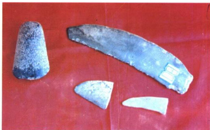
石斧、石镰 新石器时代石器，1980年在清河县杜村出土。