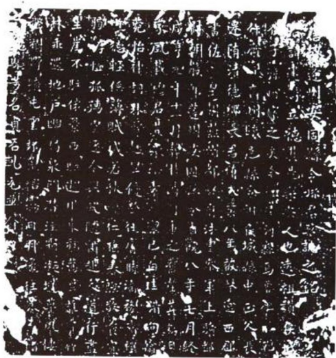
唐墓志拓片 唐孙建墓志铭，1987年5月于清河县邱家那村出土。