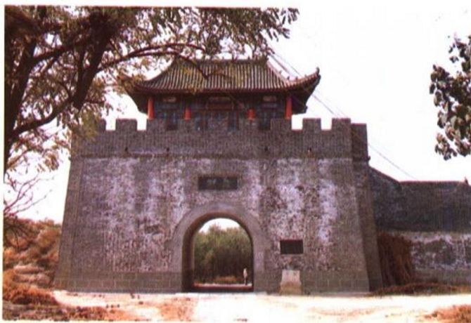
新修复明代东城门 1997年县政府拨款，重新修复，并添修阁楼。