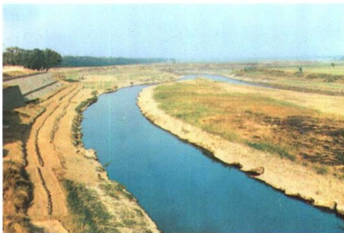
卫运河 位于清河东南部,流经县境长约25公里,也是冀鲁分界线。