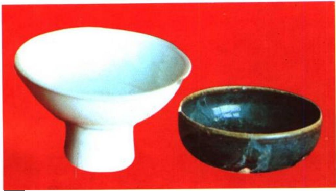
高脚杯、黑釉碗 分别为宋、元时期瓷器， 由旧城内出土。