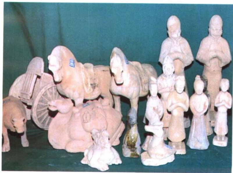
陶俑及车马 唐代白陶冥器，1987年5月于清河县邱家那村唐墓出土。