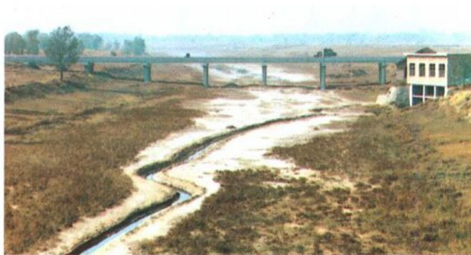
清凉江 位于清河西北部,流经县境约长30公里,是与南宫、威县分界线。