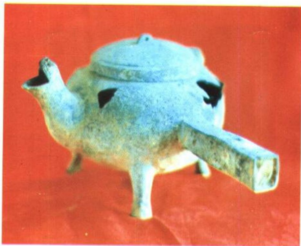
方柄三足盃 汉代青铜器，1987年于清河县刁楼庄出土。