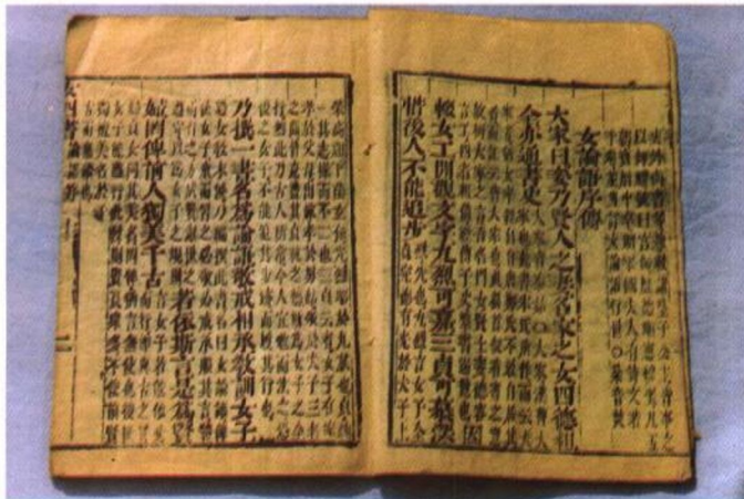
《女论语》刻本 原外地民间收藏，现存清河 县档案馆，为清代中晚期刻本。