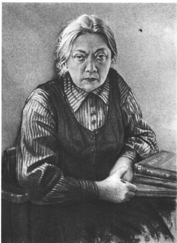
娜·康·克鲁普斯卡娅