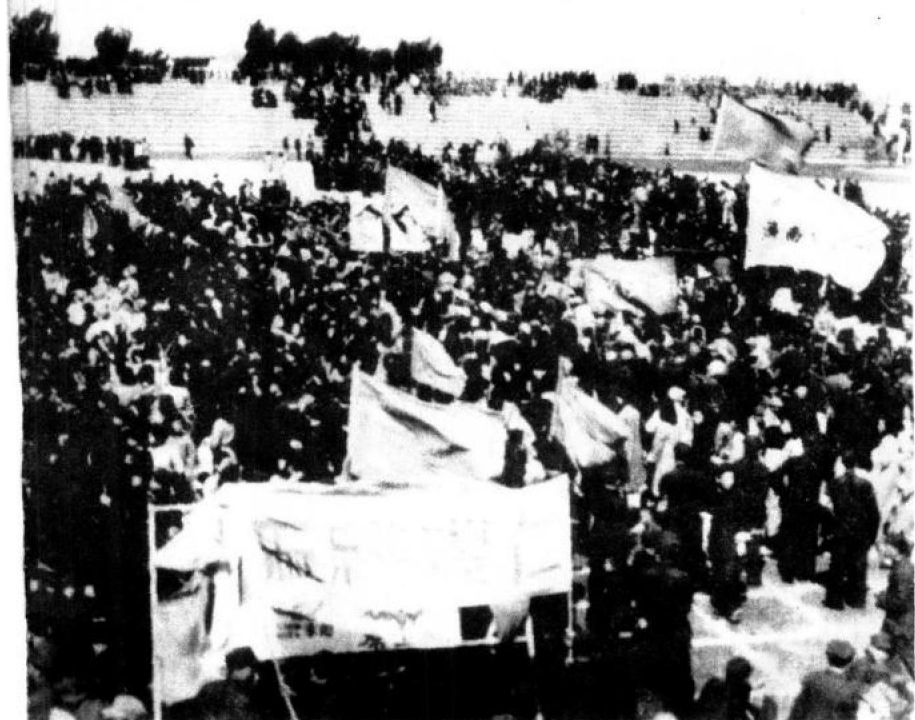
我军于一九四八年九月二十四日解放济南。图为济南市民欢庆解放。