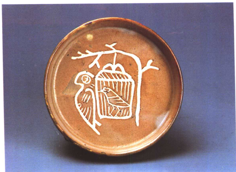
3. 羁鸟（陶瓷） 1958年