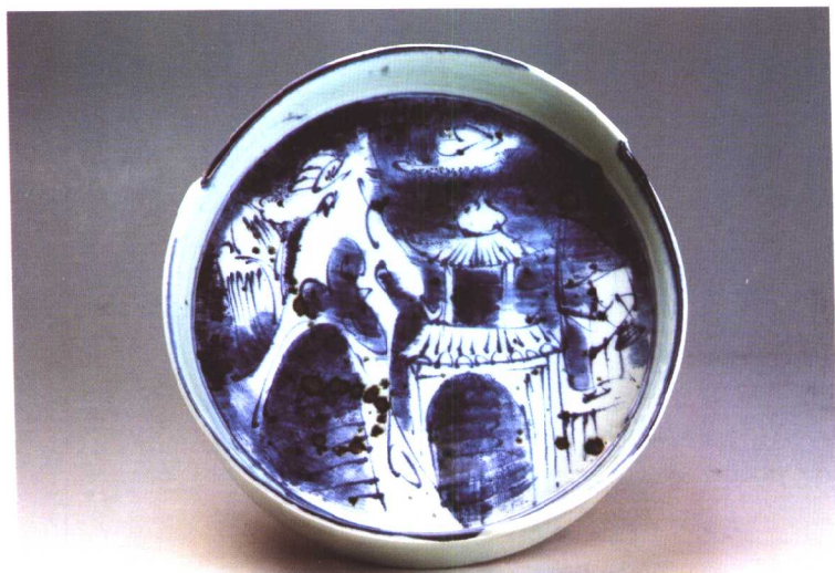
4. 云遮不住月（青花瓷） 1991年