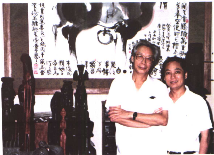
6. 与著名画家韩美林先生在工作室