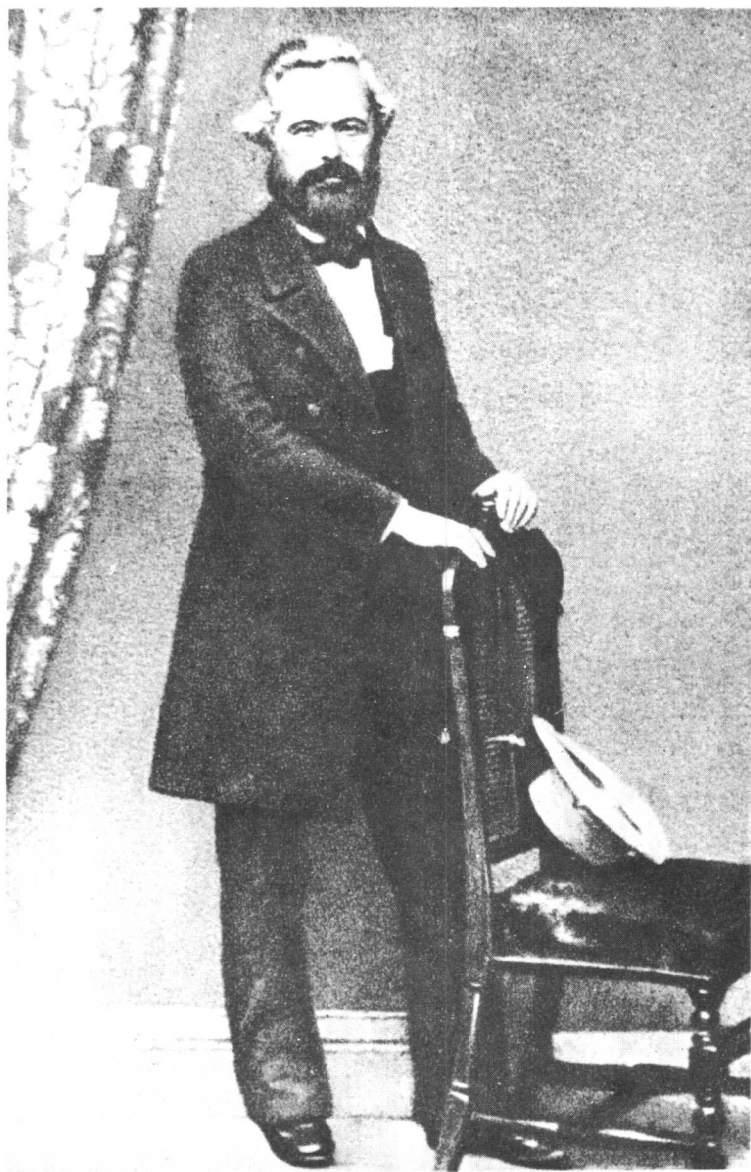
为人们所知最早拍的马克思照片