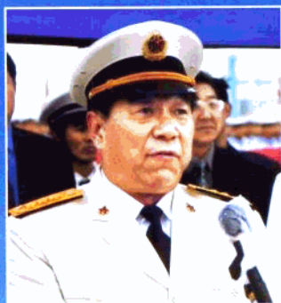
海军司令员石云生在舰艇编队启航仪式上致欢送辞