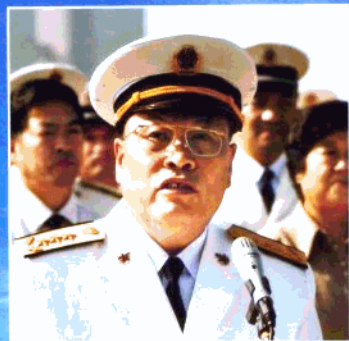
海军政委杨怀庆在舰艇编队凯旋仪式上致欢迎辞