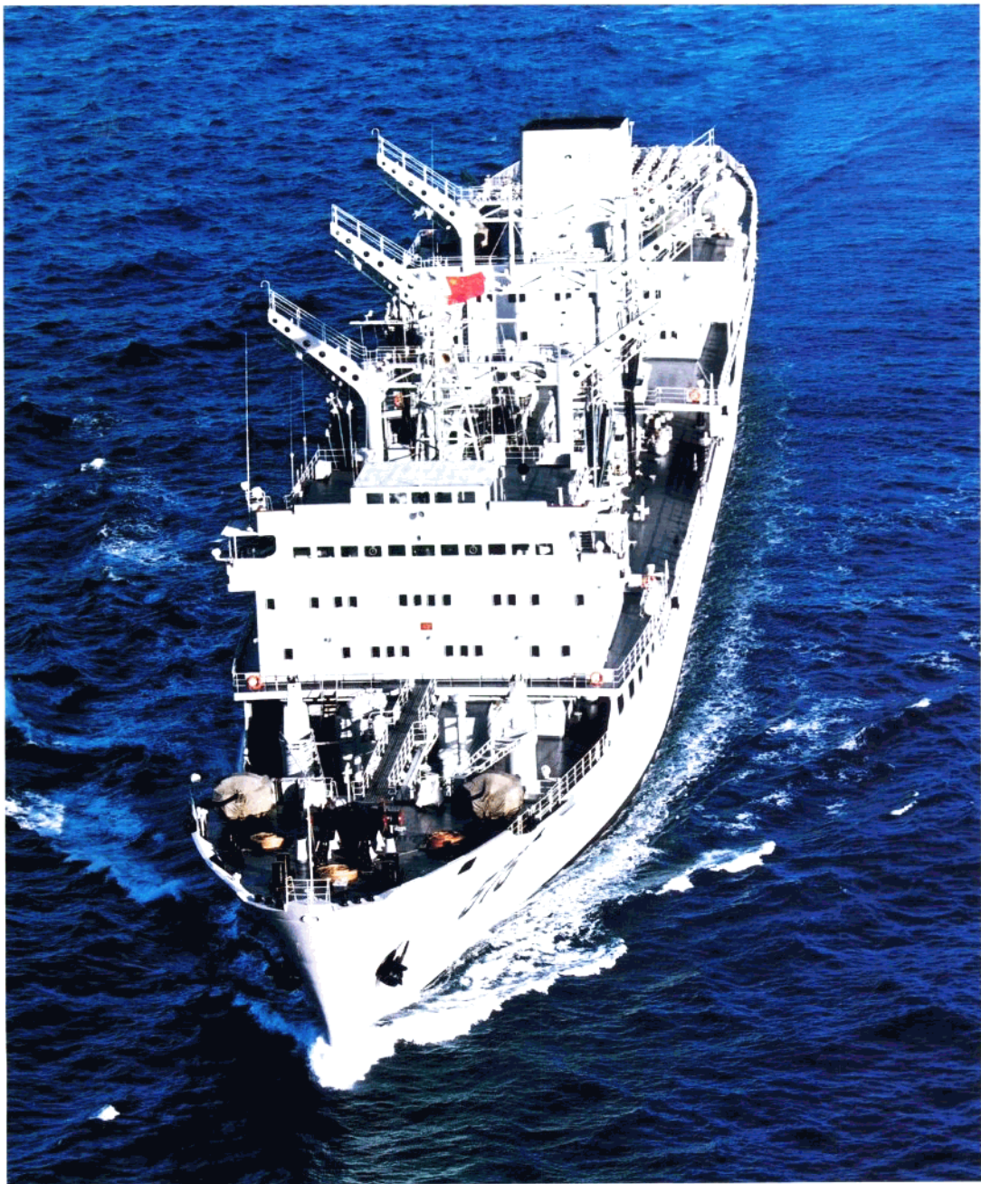
“太仓”号综合补给舰