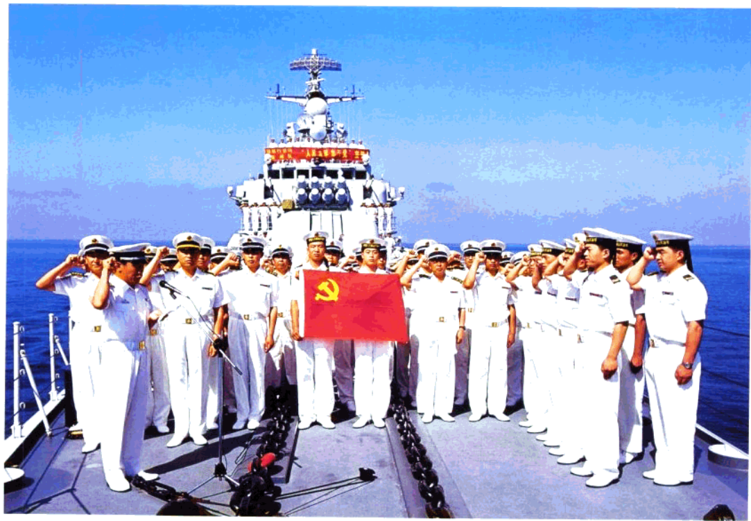
向党和祖国人民庄严宣誓