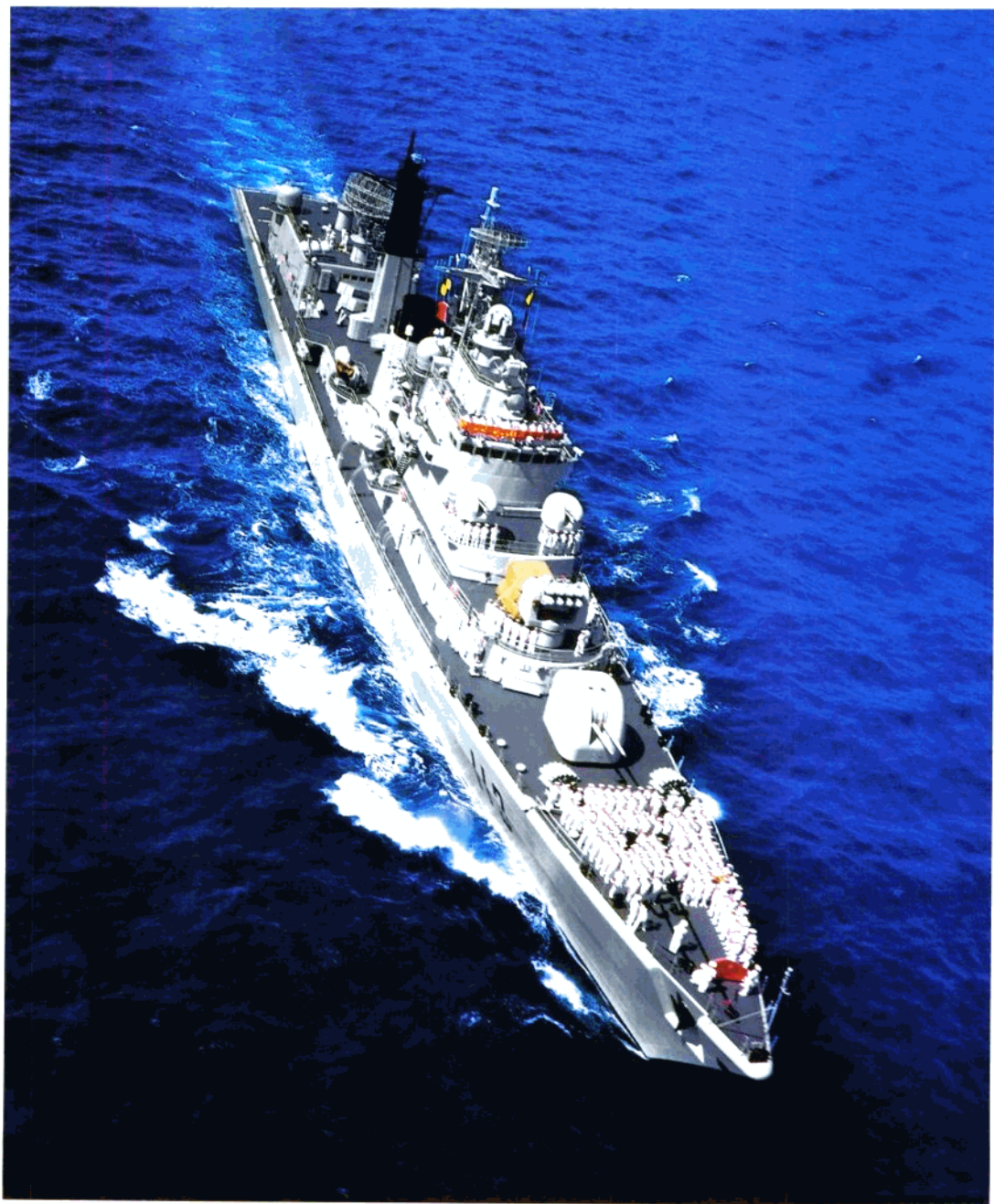
编队指挥舰——“青岛”号导弹驱逐舰