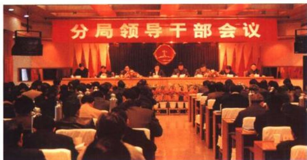
分局领导干部会议