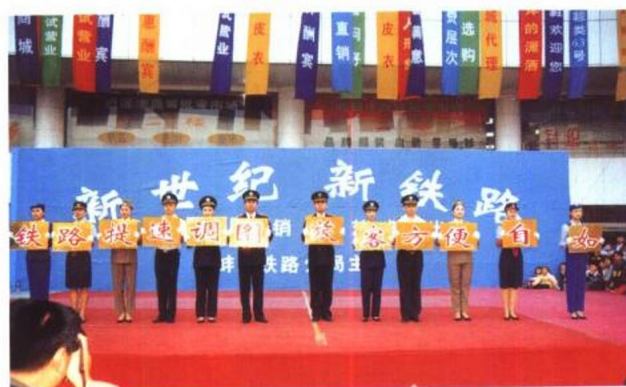
开展客货营销宣传, 努力开拓市场

蚌埠铁路分局地处安徽省境内长江以北地区, 营业里程 1171.7 公里, 是京沪、京九两大铁路干线的重要区段, 主要承担安徽及华东地区的铁路客货运输任务, 是全国运输最繁忙的铁路分局之一。在华东路网中占有十分重要的地位。