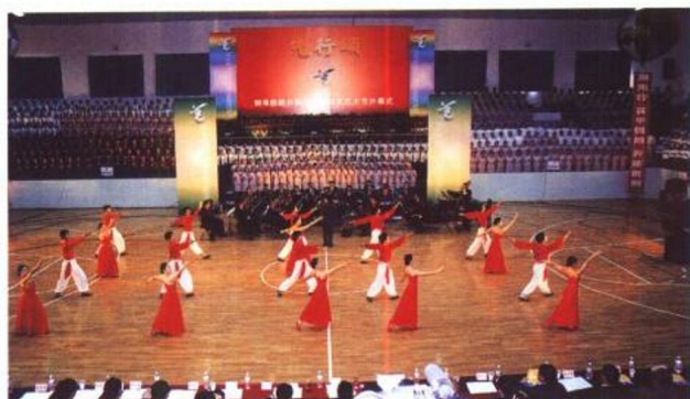
举办文化艺术节活动