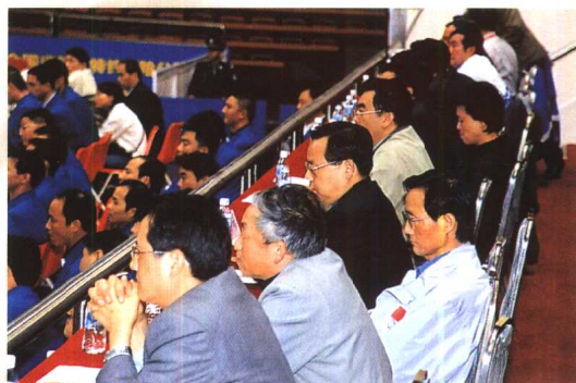
副省长蒋作君、副秘书长王坦、体育局局长张荣国观看比赛