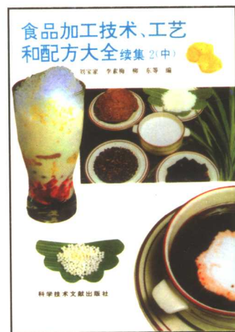
食品加工技术、工艺和配方 大全 续集2(上、中、下)