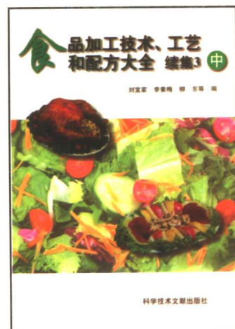
食品加工技术、工艺和配方 大全 续集3(上、中、下)