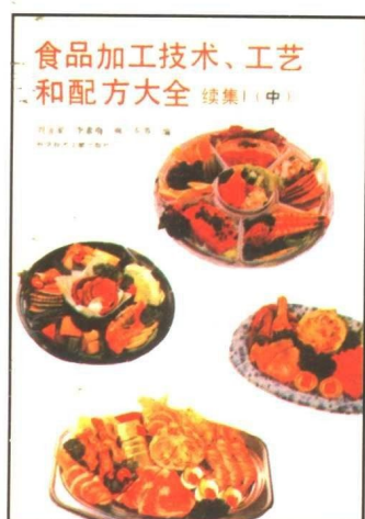
食品加工技术、工艺和配方大全 续集1(上、中、下)