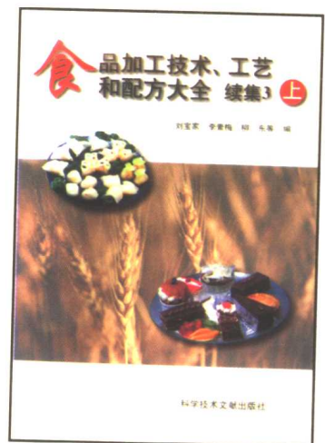
食品加工技术、工艺和配方 大全 续集3(上、中、下)