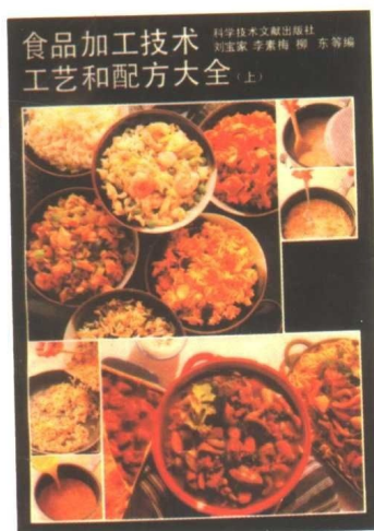
食品加工技术、工艺和配方 大全(上、中、下)