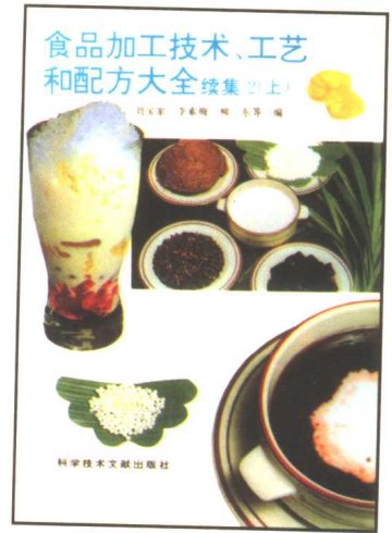
食品加工技术、工艺和配方 大全 续集2(上、中、下)