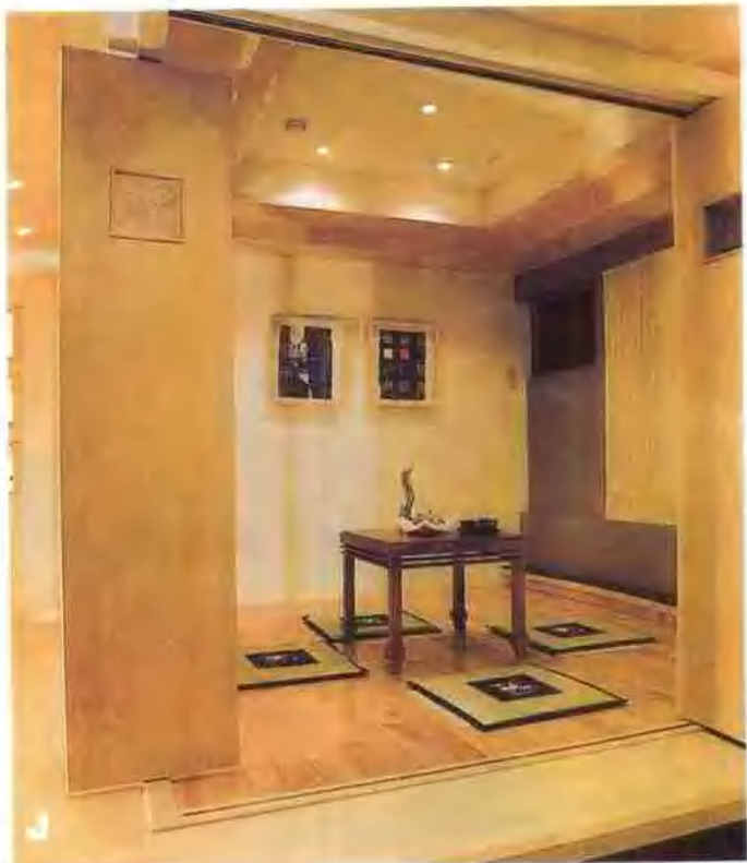
J 茶室 K 餐厅