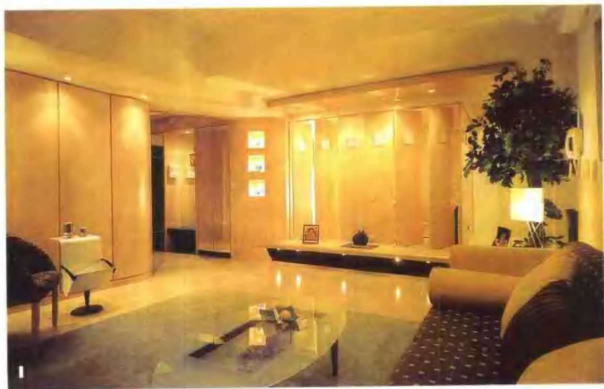
I 与墙体合二为一的电视机柜