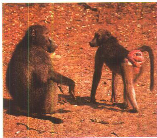
▲母狒狒月经时繁殖能力最强，她那颤动的臀部也理所当然地成为不可抗拒的性信号。