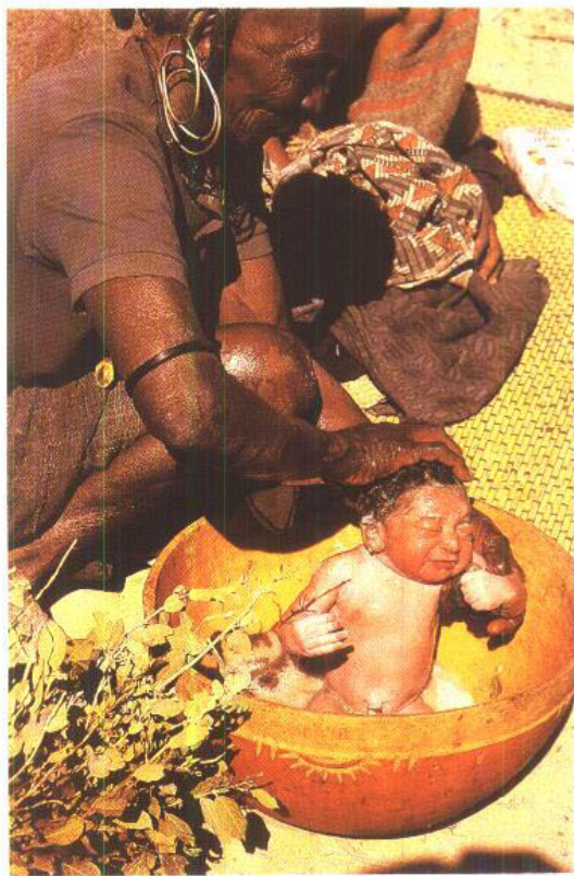
▲无论性别、教育程度、财产、种族或宗教信仰如何，我们来到这个世界的时候都是赤身裸体的。

如果与同一星球的其它各种动物相比，赤裸的人体显得极其单调和羸弱。我们没有任何用来遮挡、保护自己肉身的东西，诸如羽毛、鳞甲、利齿或脚爪之类。在 193 种灵长目动物中，人类显得形销骨立，连猴子、类人猿、狒狒那样的毛皮也没有。