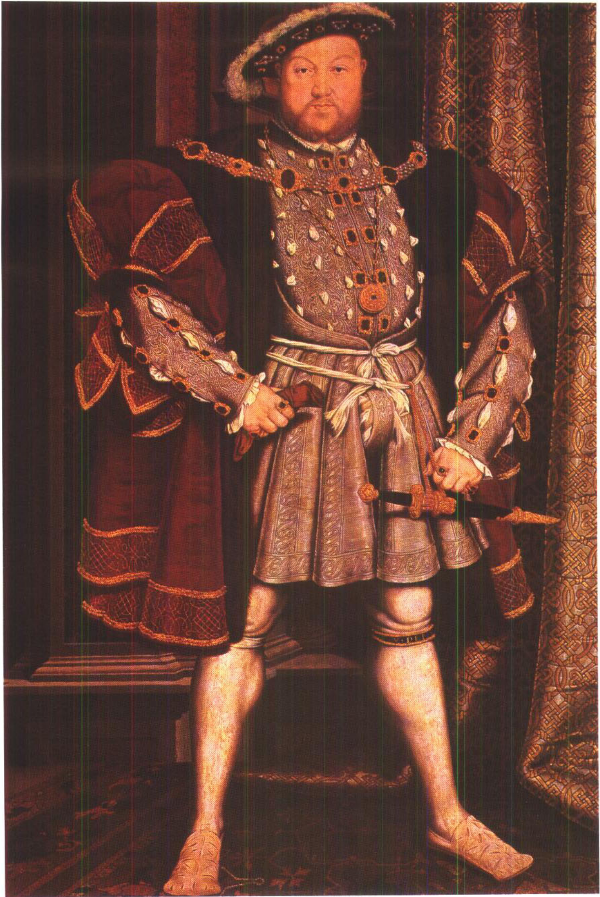
▲“在人类的历史中，以服装美替代身体美的趋势早已出现。” H·埃利斯(Havelock Ellis)《性心理学研究》第四卷 1905