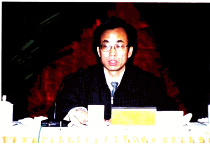
山东省委宣传部副部长王凤胜同志在开幕式上讲话