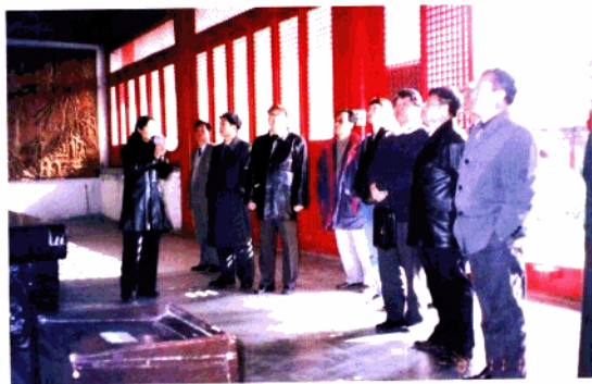
2000年11月16 日-17日，山东省社 科界知名专家学者 考察黄河三角洲文 化