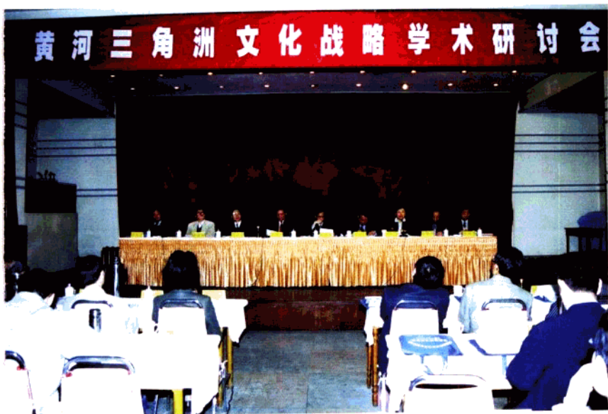
黄河三角洲文化战略学术研讨会开幕式