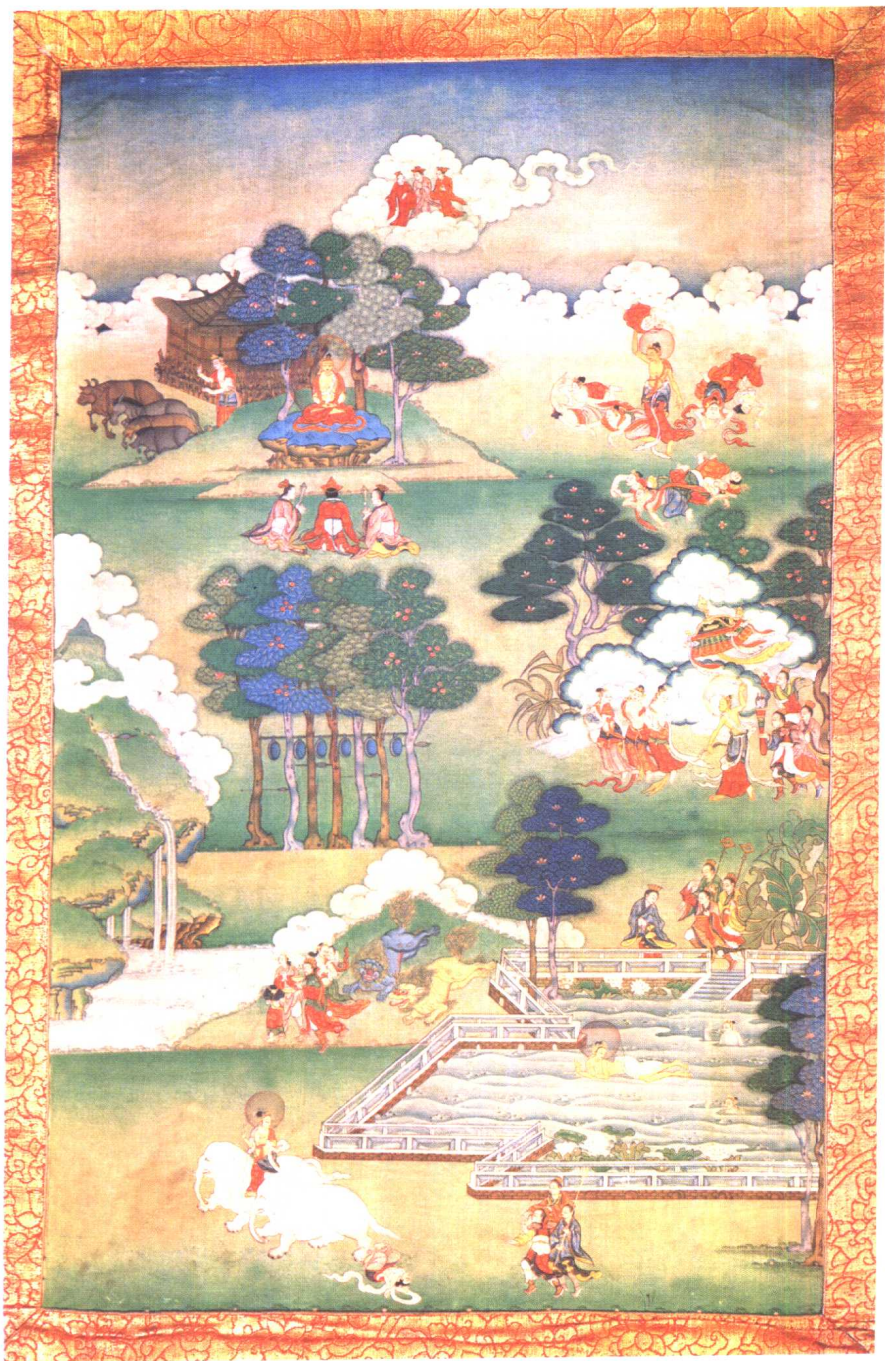
出游图——感受生老病死之一