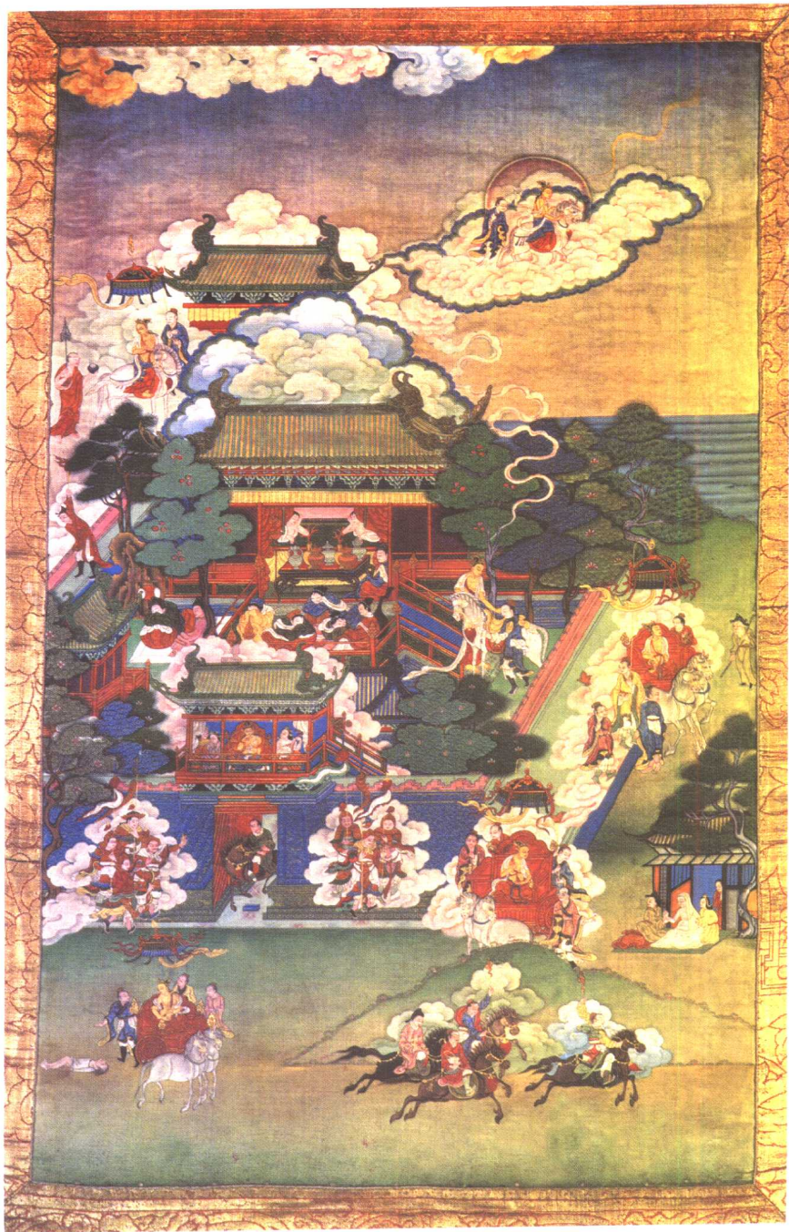
出游图——感受生老病死之二