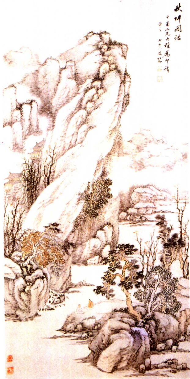
清·汤贻汾 《秋坪闲话图》