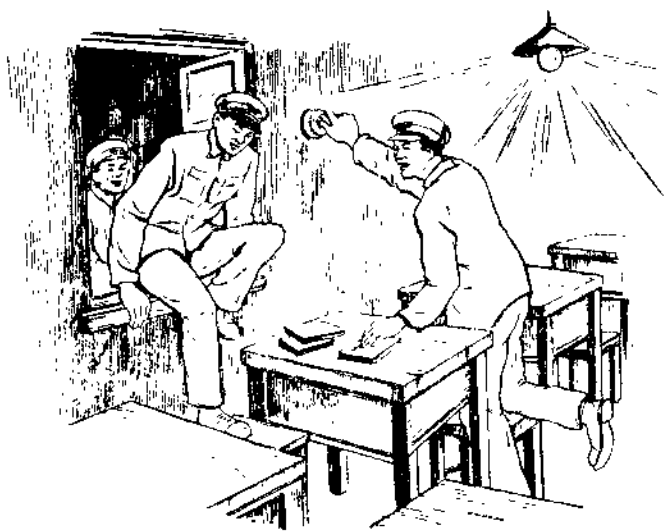
夜晚從窗戶鑽進教室去學習

了，並且可以把它算出來。可是我呢，一看兩瞪（ㄉㄥ）眼，誰也不認識誰。怎麼辦呢，趕不上不行呀！有幾個同志跟我一樣，沒唸（ㄩㄢ）過什麼書，我們一商量，就利用晚上的時間學起來。人家睡着了，我們起來，可是集體生活不允許這樣，你晚上起來的時候，把別人吵醒了，別人就要給你提個小意見，說你影響人家休息。所以要偷偷地起來，然後再偷偷地從教室窗戶爬進去。要知道，在夜間，教室可不是給你預備的，門都上了鎖，就得從