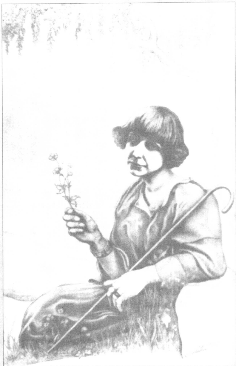
玛·茨维塔耶娃的画像 作者为罗德泽维奇