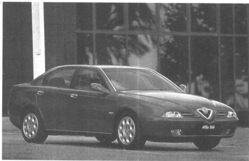
1998年的阿尔法166型汽车(Alfa 166)。