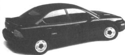
企业内部设计部门的设计作品案例：克萊斯公司的1996年McLAREN F1車。