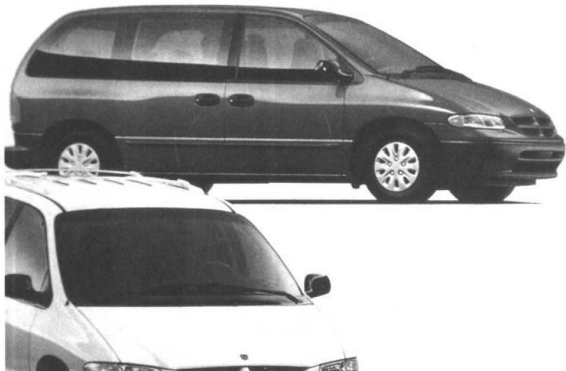
企业内部设计部门的设计作品举例：克莱斯勒公司主力销售车型箱型车(俗称面包车)，这种车有四个主要型号，这是1996年 VOYAGER。

现代设计是现代经济和现代市场活动的组成部分，因而，不同的市场活动，也造成不同的设计范围。如果从全面情况来看，现代设计一般来讲包括以下几个大的范畴，即