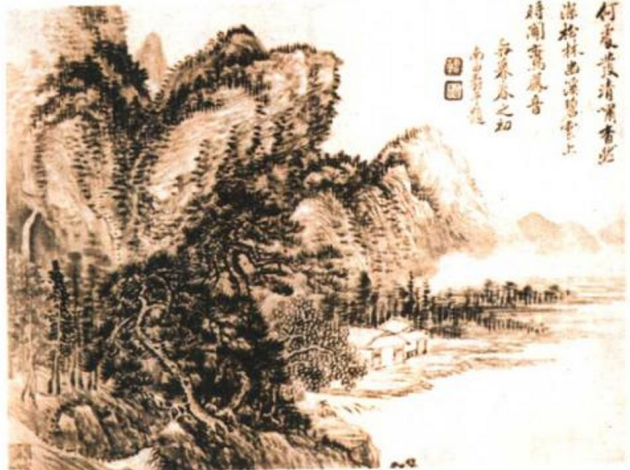
清·王肇·《仿古山水册》之二

① 分携：分手，离别。② 清眺：眼前所展现的清幽之景。③ 太素：形成天地万物的物质。乘：操持，掌握。元化：大自然的发展变化。④ 九山：指轘辕、颍谷、告成、少室、大箕、大隄、大熊、大茂、具茨九座山岭。⑤ 了：根本，完全。陵跨：跨越。⑥ 澹澹：水波微动貌。⑦ 吟啸：高声吟唱。⑧ 尘土：指世俗。悲咤：悲叹。