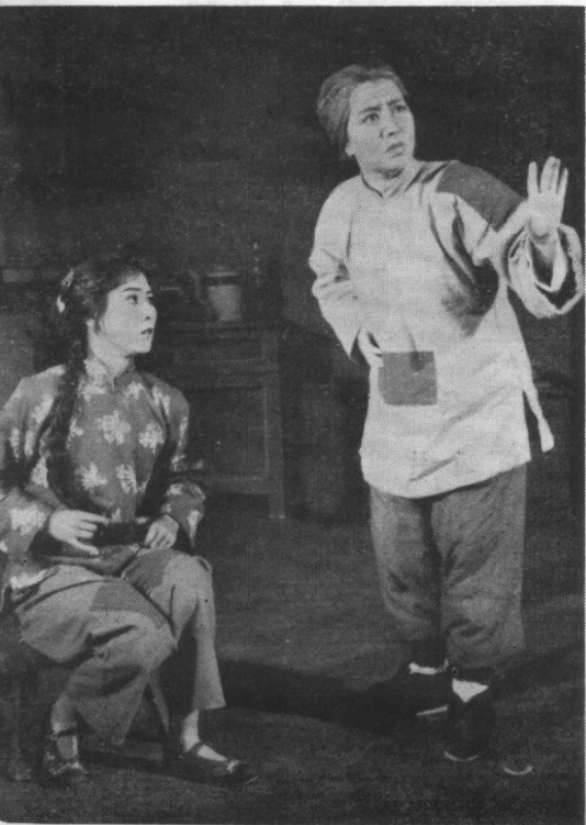
第五場 痛說革命家史