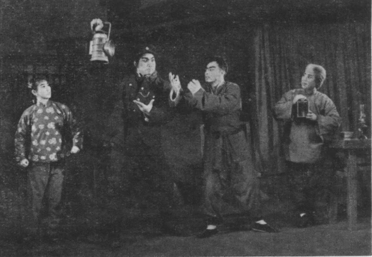
第一場 救護交通員