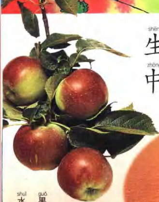
shuǐ guǒ 水 果

xǔ duō zhǐ wù huì zhǎng chū gān 许 多 植 物 会 长 出 甘 tián duō zhī de shuǐ guǒ fēi 甜、多 汁 的 水 果，非 cháng hào chī。 常 好 吃。