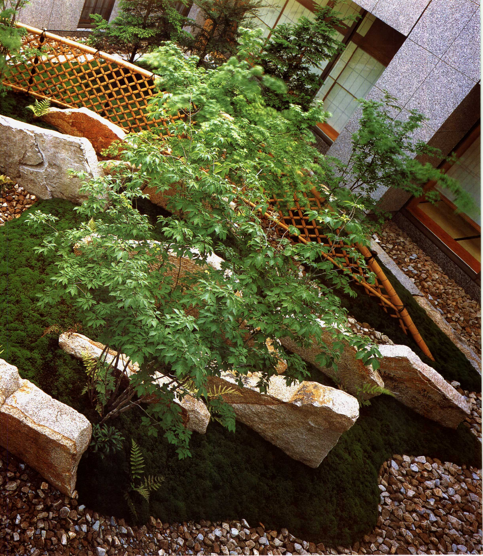
条石、地被植物、石子、枫树、竹栅……构成庭园的俯视效果