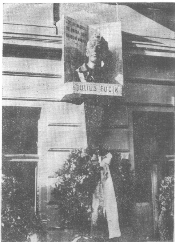
尤·伏契克故居（布拉格）牆上的紀念碑和雕像。 此屋是尤·伏契克的誕生地。