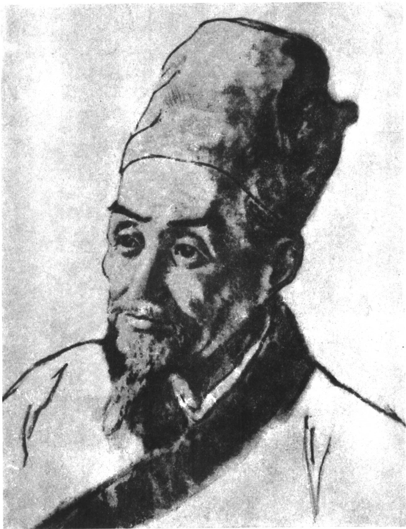
李時珍 (1518—1593) (蔣兆和繪)