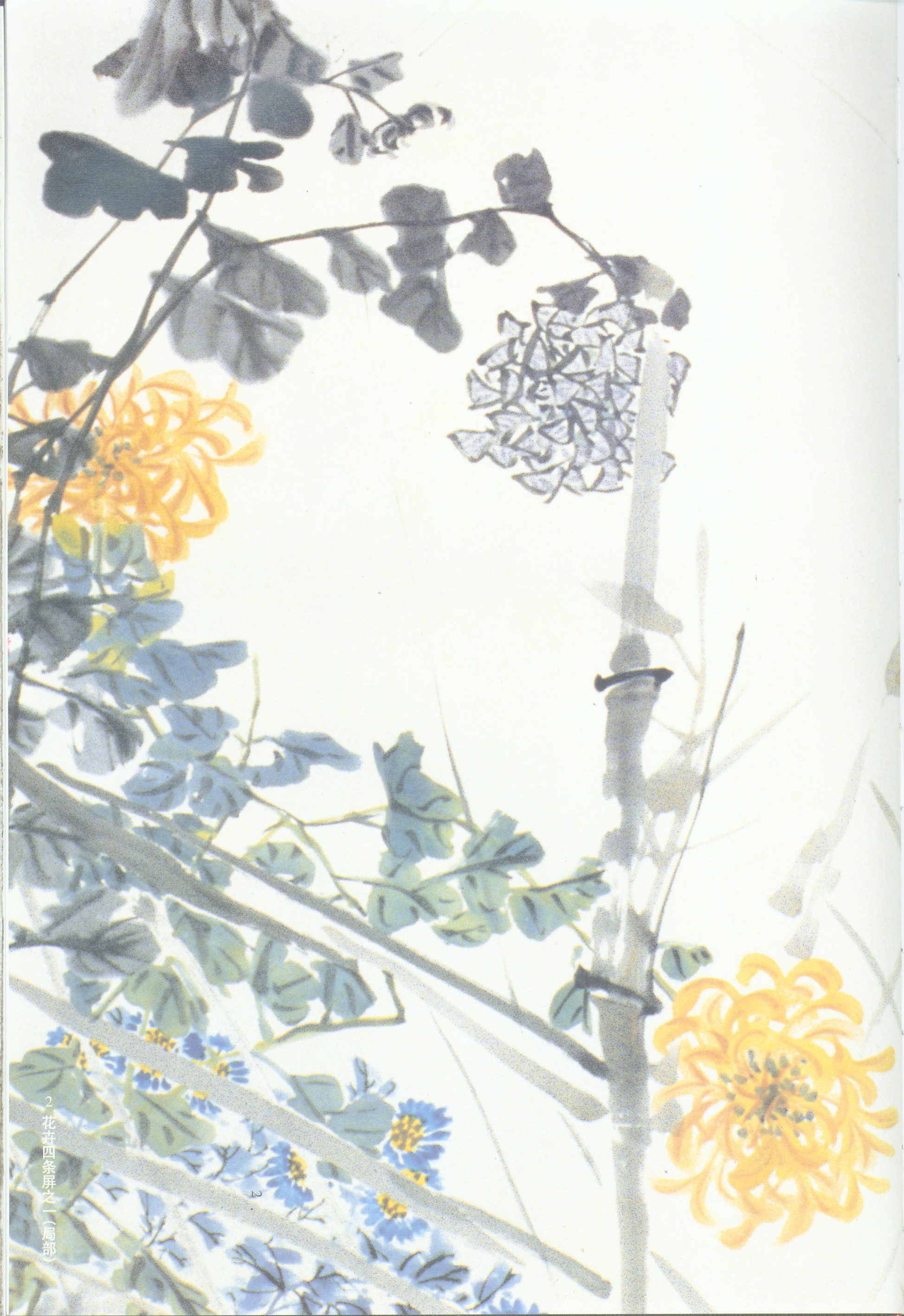
2 花卉四条屏之一(局部)