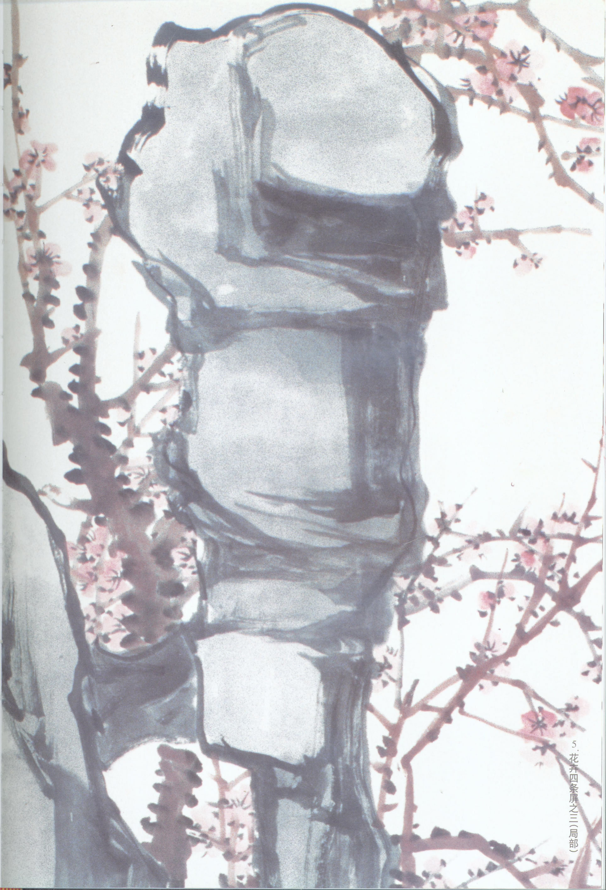
5. 花卉四条屏之三(局部)