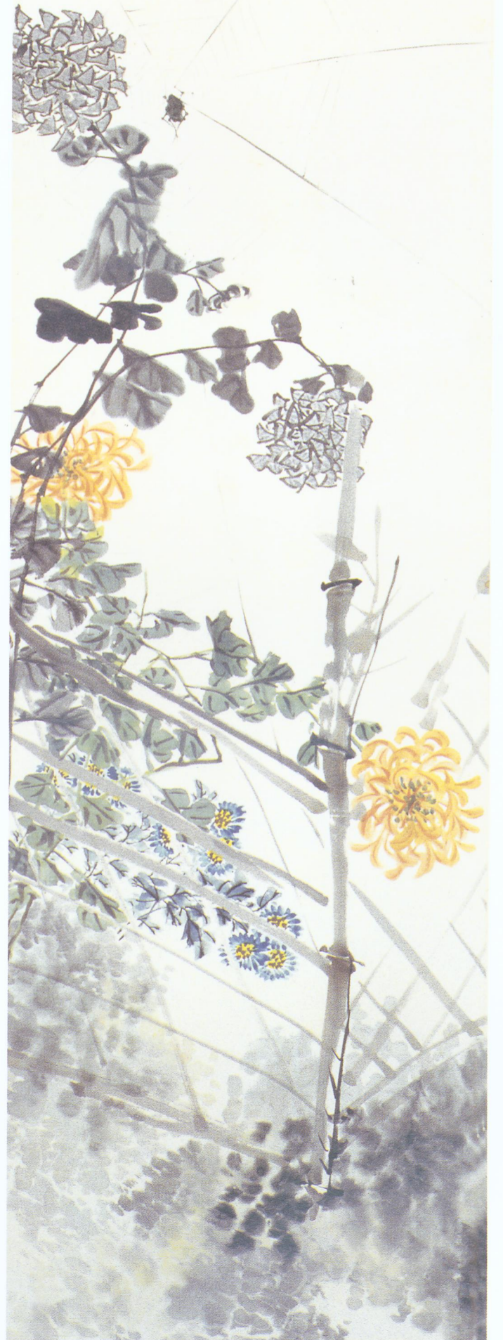
1. 花卉四条屏之一 纸本 立轴 设色 168.4cm × 42.8cm 故宫博物院藏