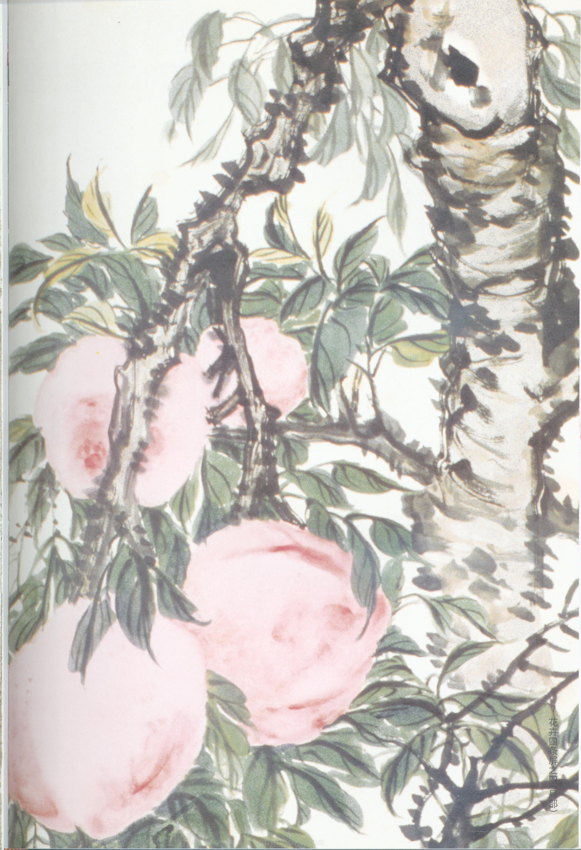
7. 花卉四条屏之四（局部）