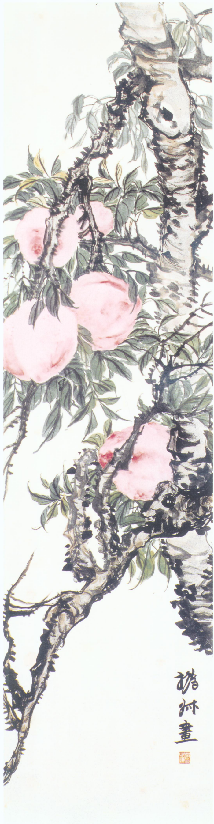
6. 花卉四条屏之四 纸本 立轴 设色 168.4cm × 42.8cm 故宫博物院藏