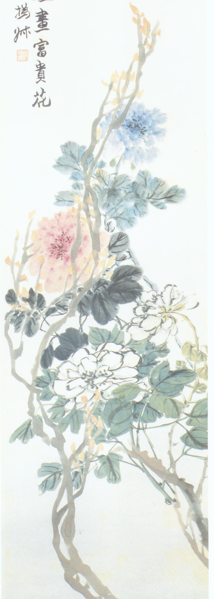
3. 花卉四条屏之二 纸本 立轴 设色 168.4cm × 42.8cm 故宫博物院藏