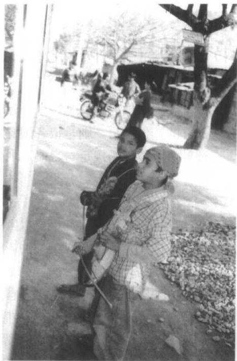
◇尼泊尔在街头卖唱的少年。